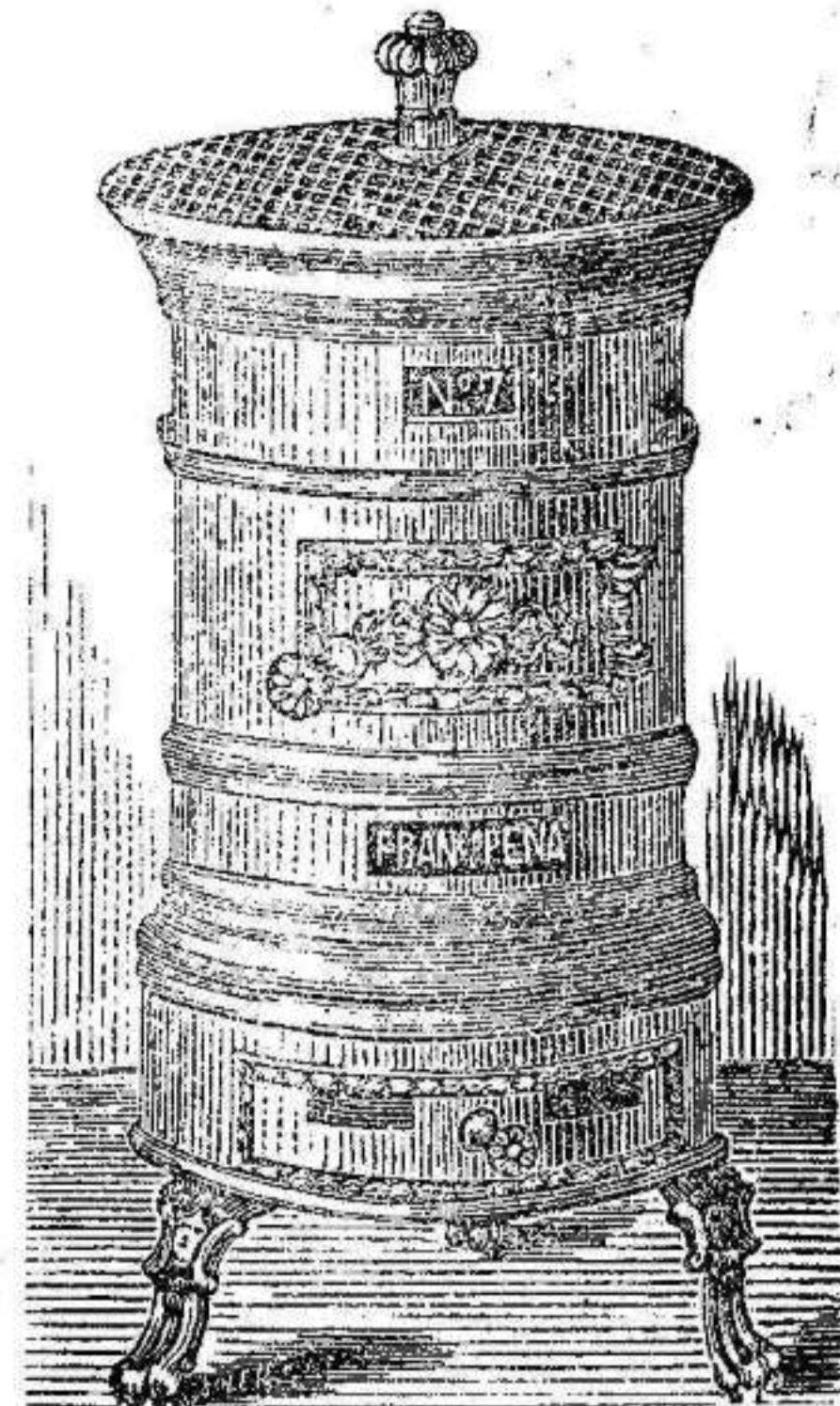
ESTUFA HIERRO FUNDIDO

Gran surtido en Chuberski, chimeneas francesas para cok y leña y demás materiales de calefacción.