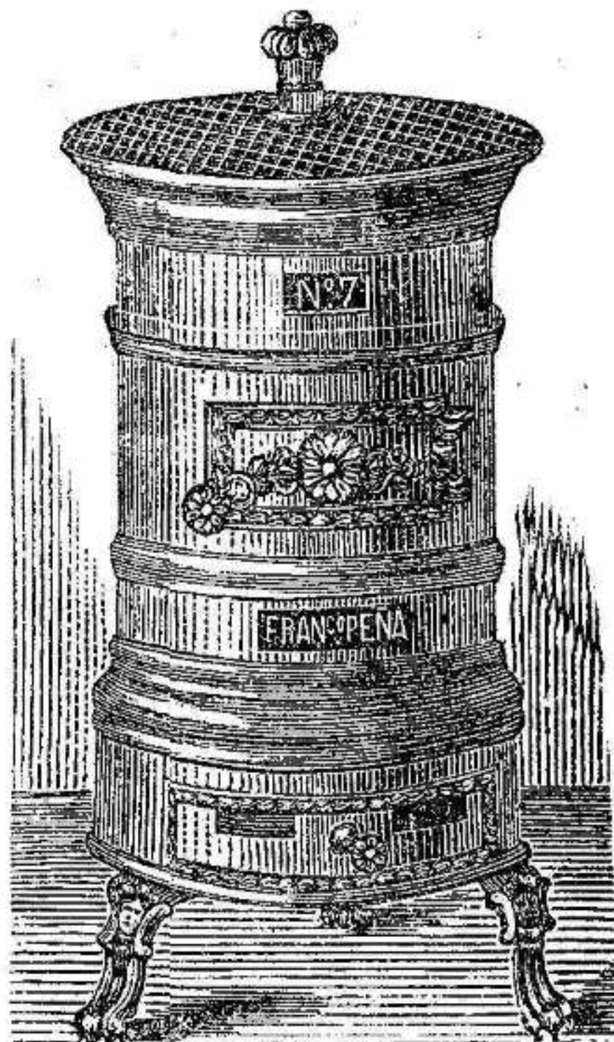
ESTUFA HIERRO FUNDIDO