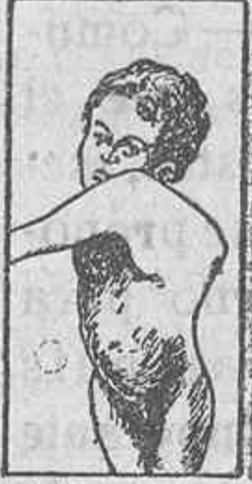
MAL DE POTT O CIBROSIDAD