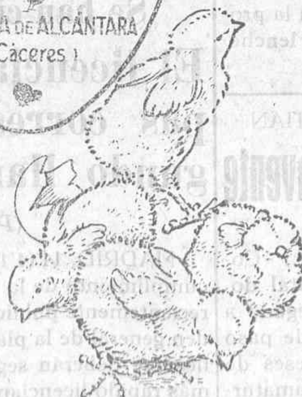
Polluelos recién nacidos