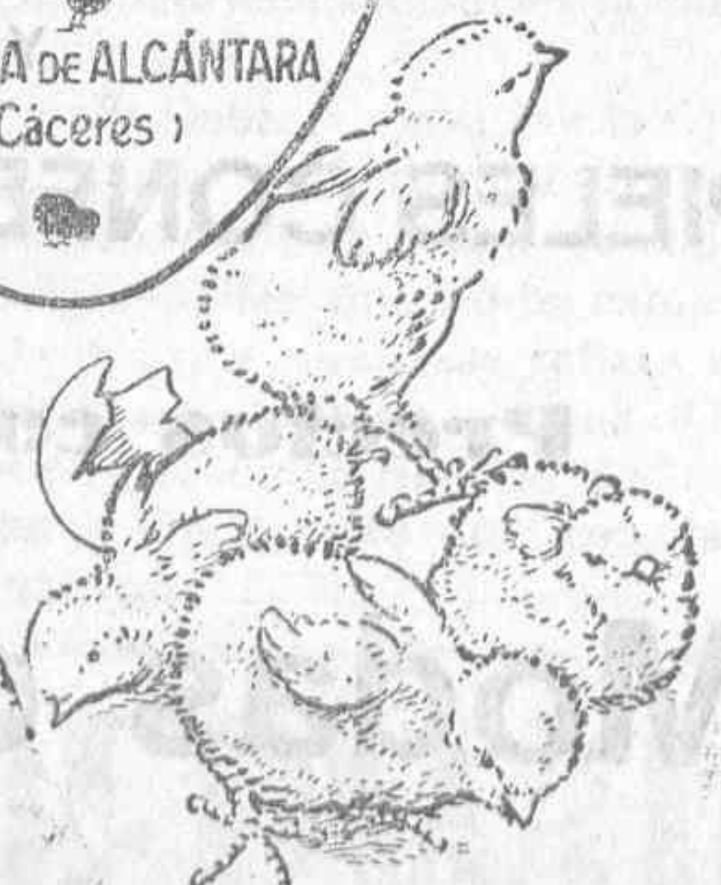
Pa lluelos recién nacidos