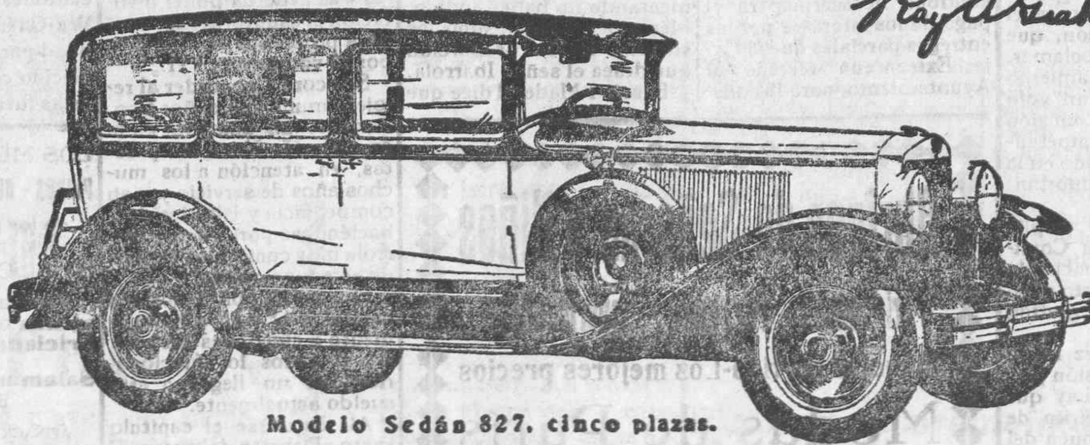
Modelo Sedán 827. cinco plazas.

Joseph B. Graham Robert B. Graham Ray A. Graham