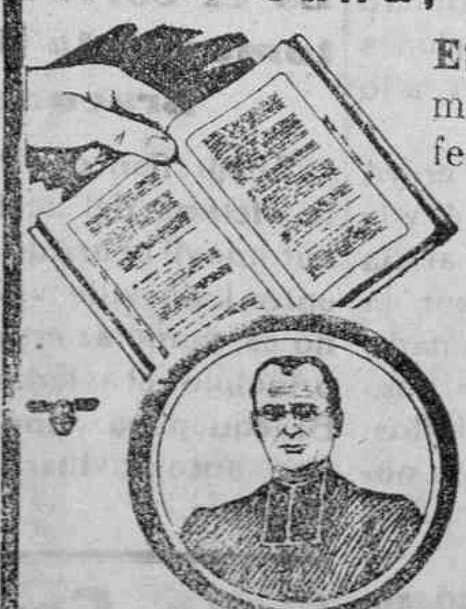
LAS 20 CURAS VEGETALES DEL ABATE HAMON

SE ENVIA GRATIS. Mande hoy este cupón en sobre abierto con sello de 2 cts.