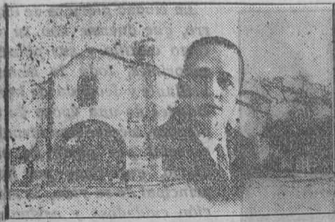
Valencia de Alcántara... La llave de Cáceres con Portugal; la ciudad que luce en su blasón junto al emblema y la venera de la Orden de los Caballeros Alcantarinos, la llave de su fortaleza...

Una de las más prósperas poblaciones de la provincia de Cáceres, con un censo superior a 15.000 habitantes entre el casco de la población y su bellísima campiña.