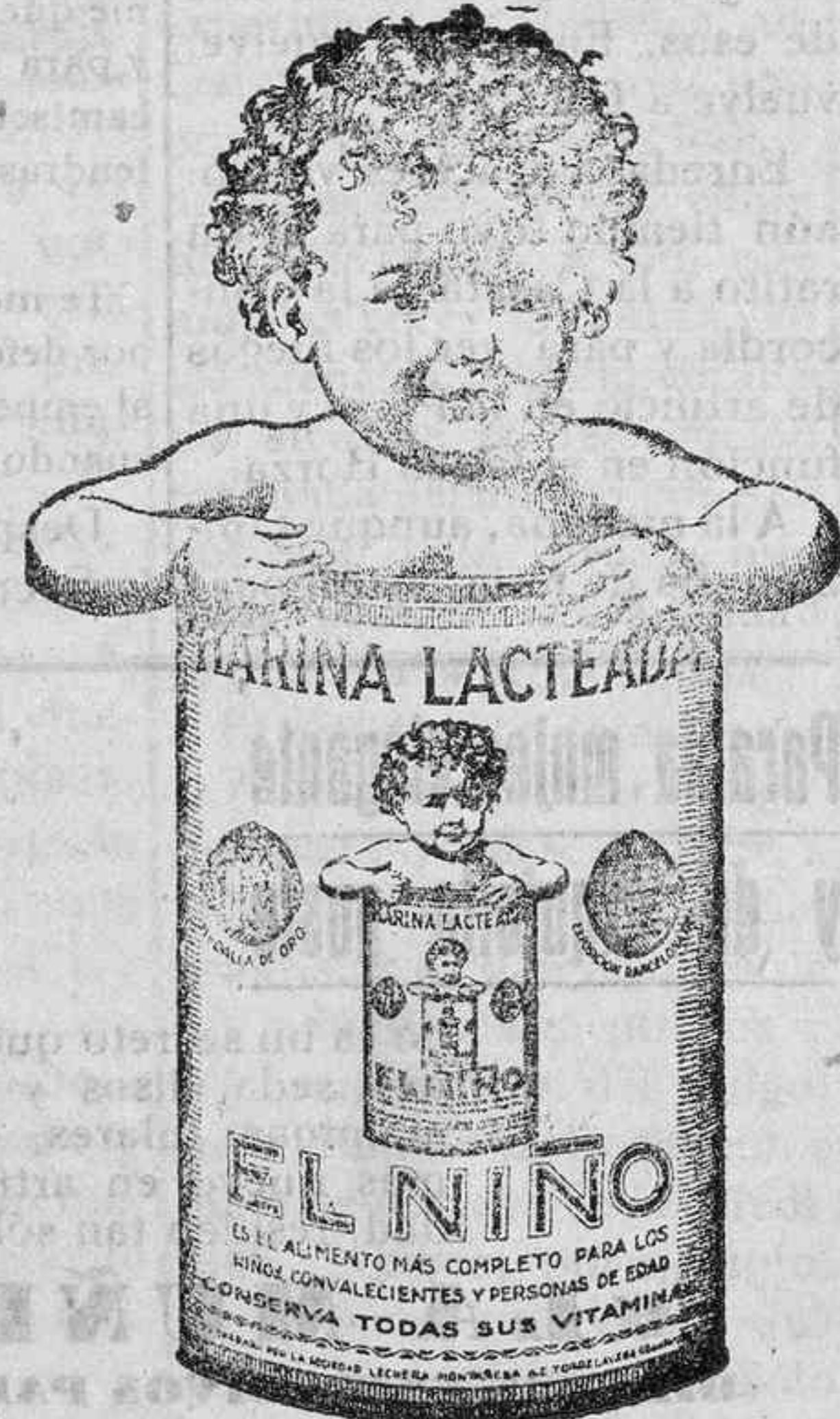
Harina EL NIÑO es la mejor en CALIDAD y sabor

BUQUE A PIQUE Se ha salvado la tripulación y el pasaje