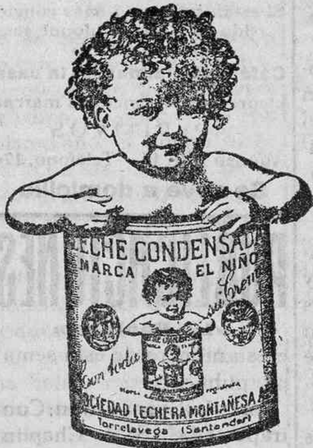
Leche EL NIÑO es la mejor en CALIDAD y sabor