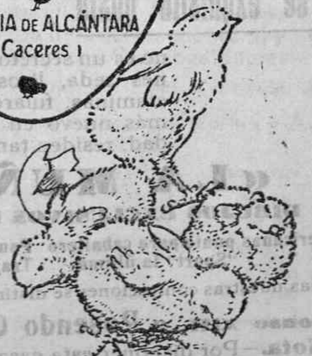
Polluelos recién nacidos