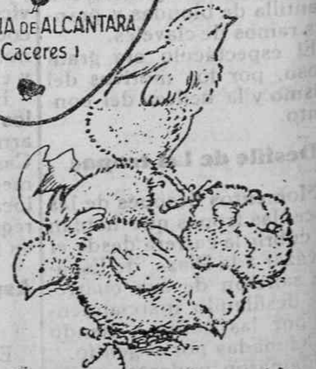
Polluelos recién nacidos