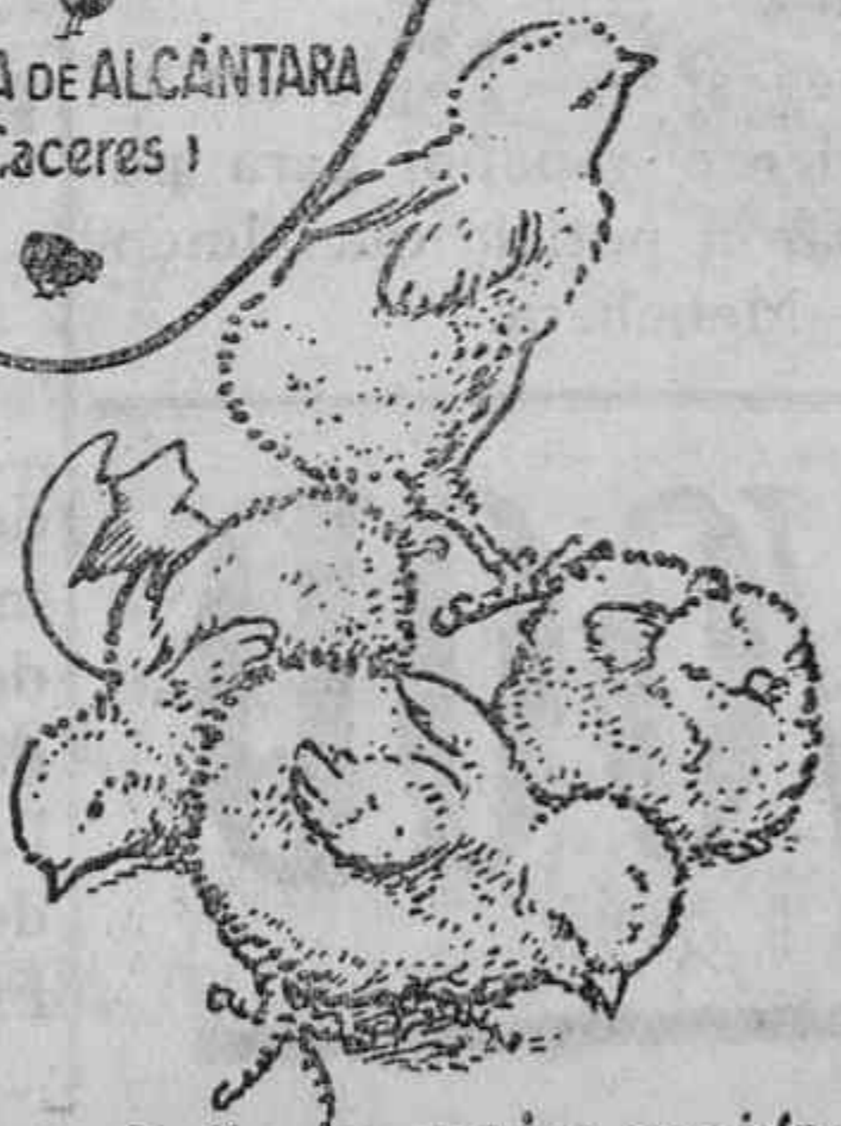
Polluelos recién nacidos