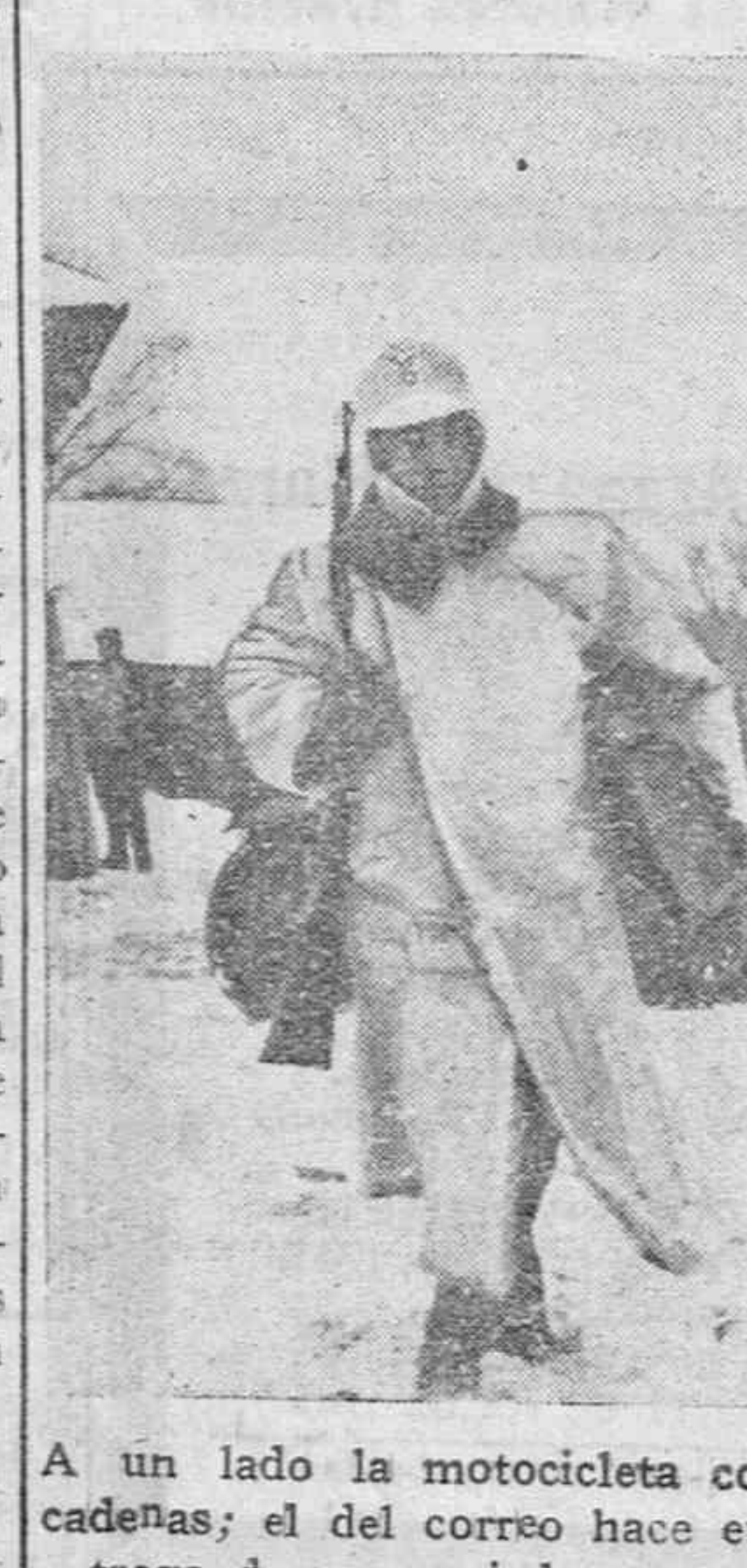
A un lado la motocicleta con cadenas; el del correo hace entrega de su preciada carga.

COMUNICADO ITALIANO Roma.—El mal tiempo ha res-