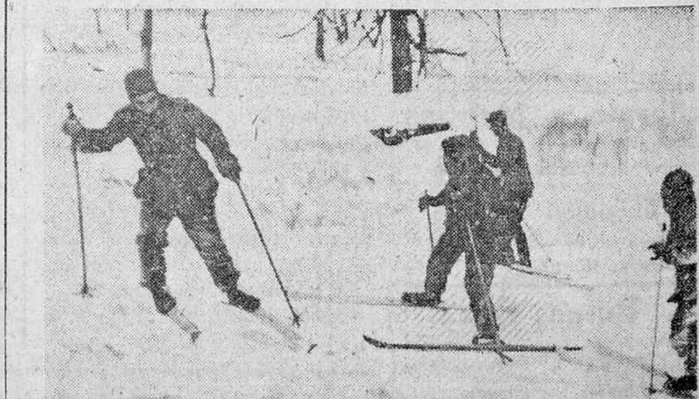
Compañías de esquiadores españoles toman parte en acciones de guerra. He aquí uno de los ejercicios de entrenamiento.