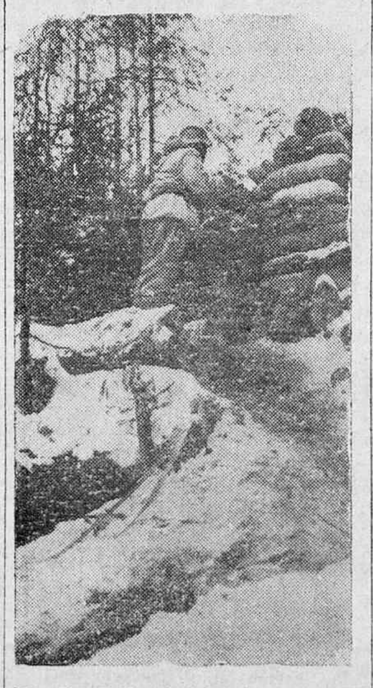
En el tejado del fortín donde se aloja un grupo de soldados alemanes, ha de hallarse siempre uno de ellos en servicio de vigilancia.