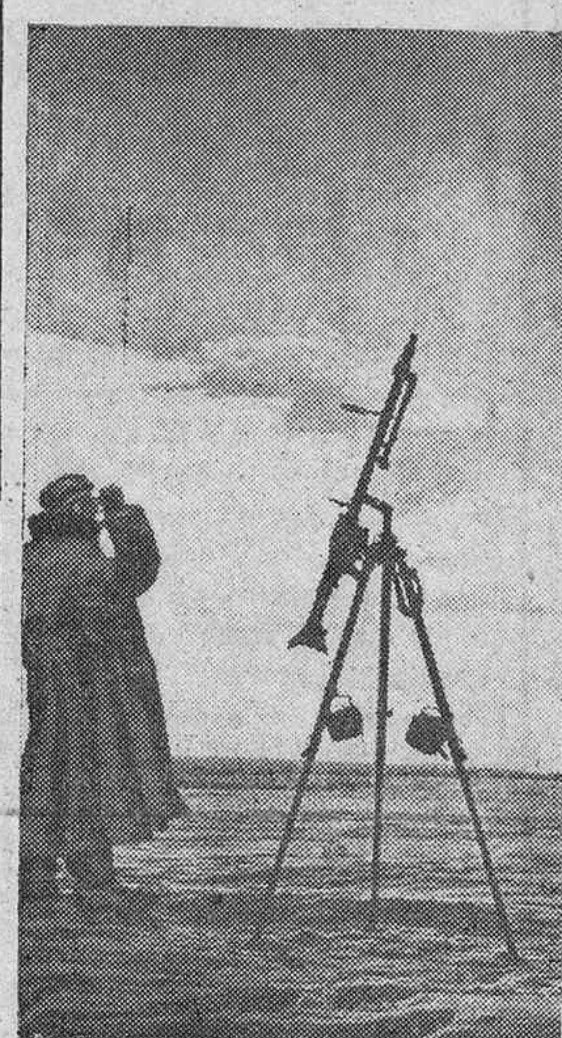
Un puesto de observación contra los aviones enemigos en el frente oriental.