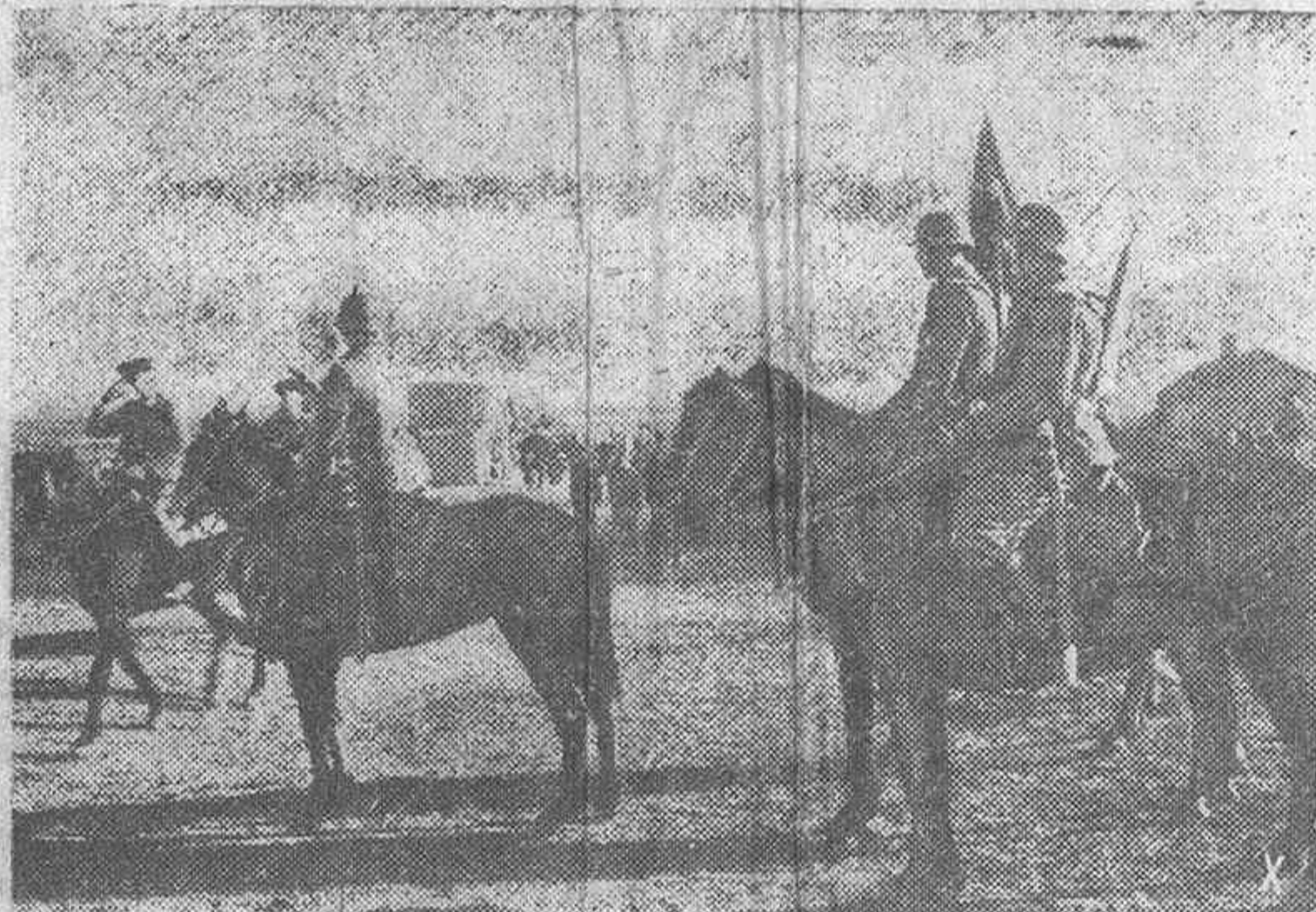
Antes del juramento de cosacos el comandante alemán del Regimiento acabarga ante ellos.