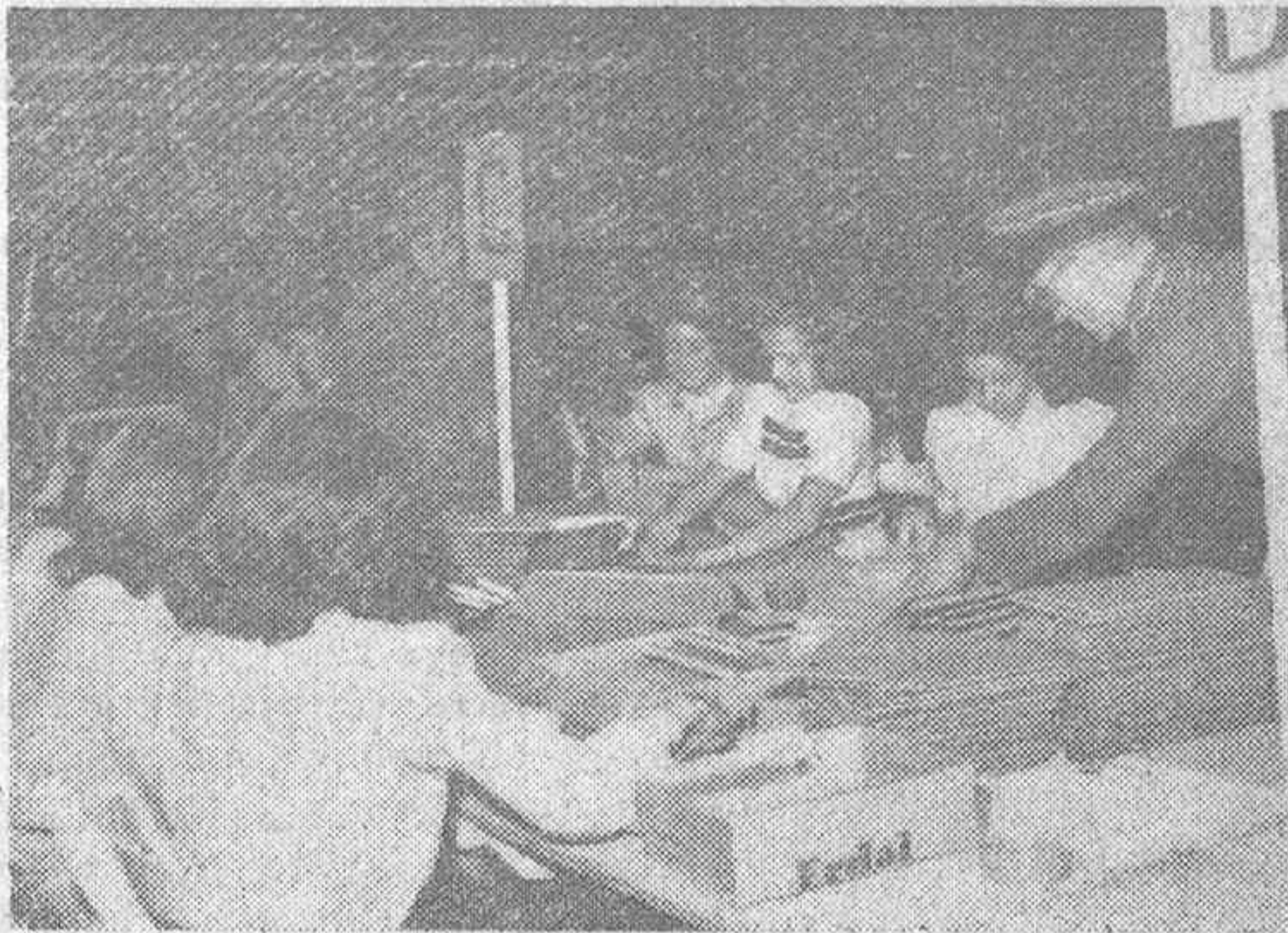
Los países en guerra han rivalizado en el envío a sus soldados de los obsequios de Pascuas.