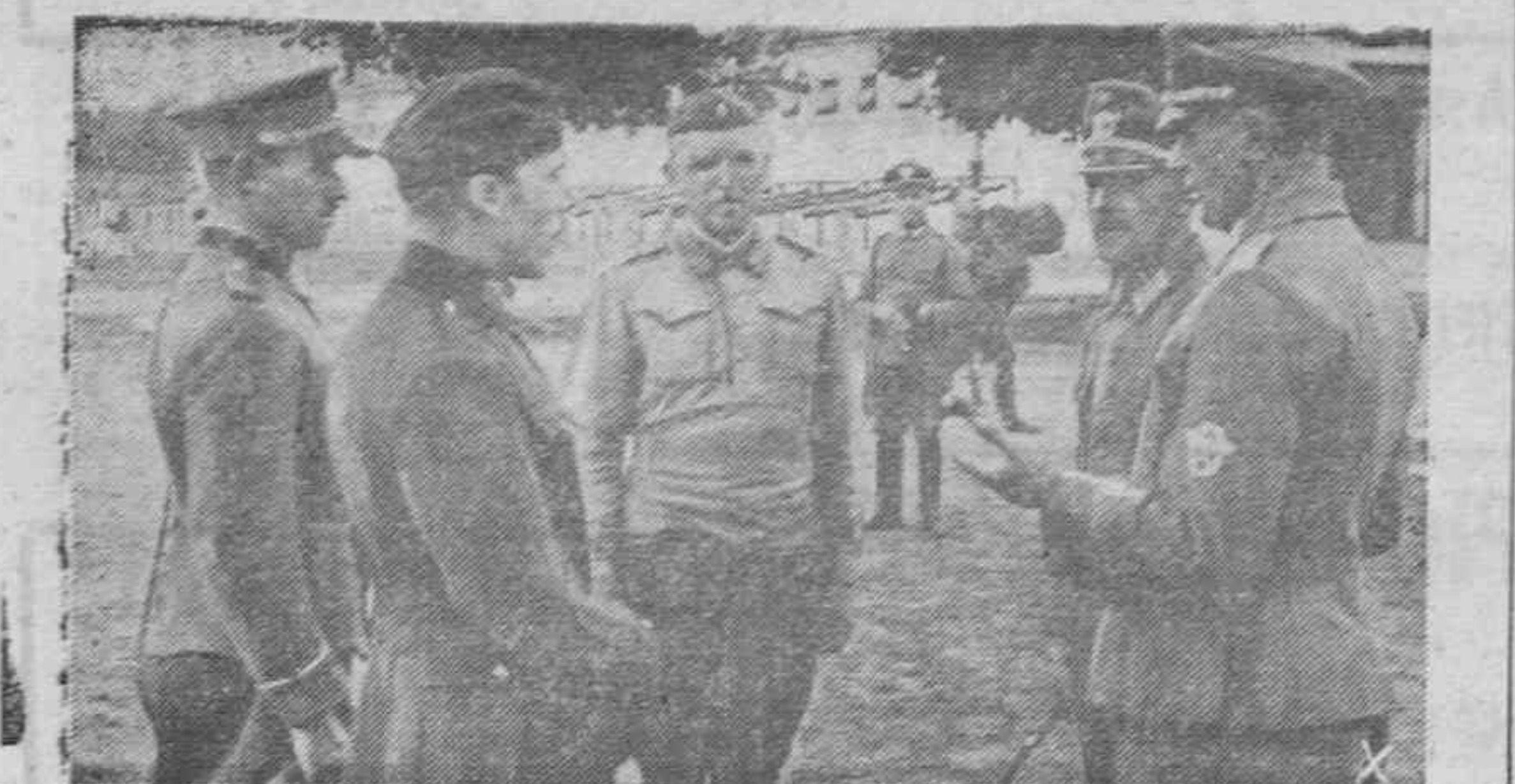
La policía alemana en el Este instruye a los oficiales de caballería nativos, que voluntariamente se han puesto a disposición del Ejército alemán.