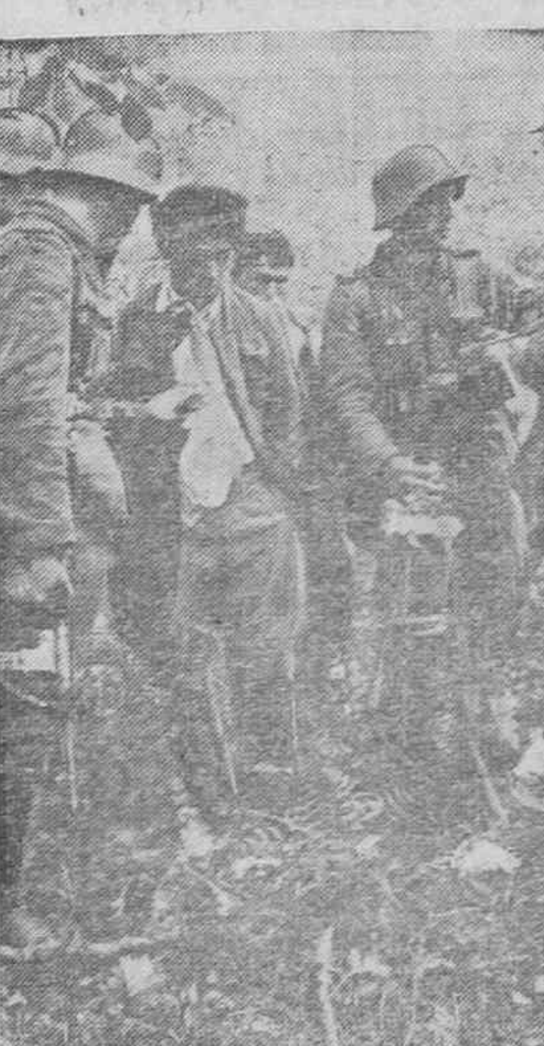
Un grupo de francotiradores soviéticos que dificultaban los movimientos de los alemanes, ha sido capturado.