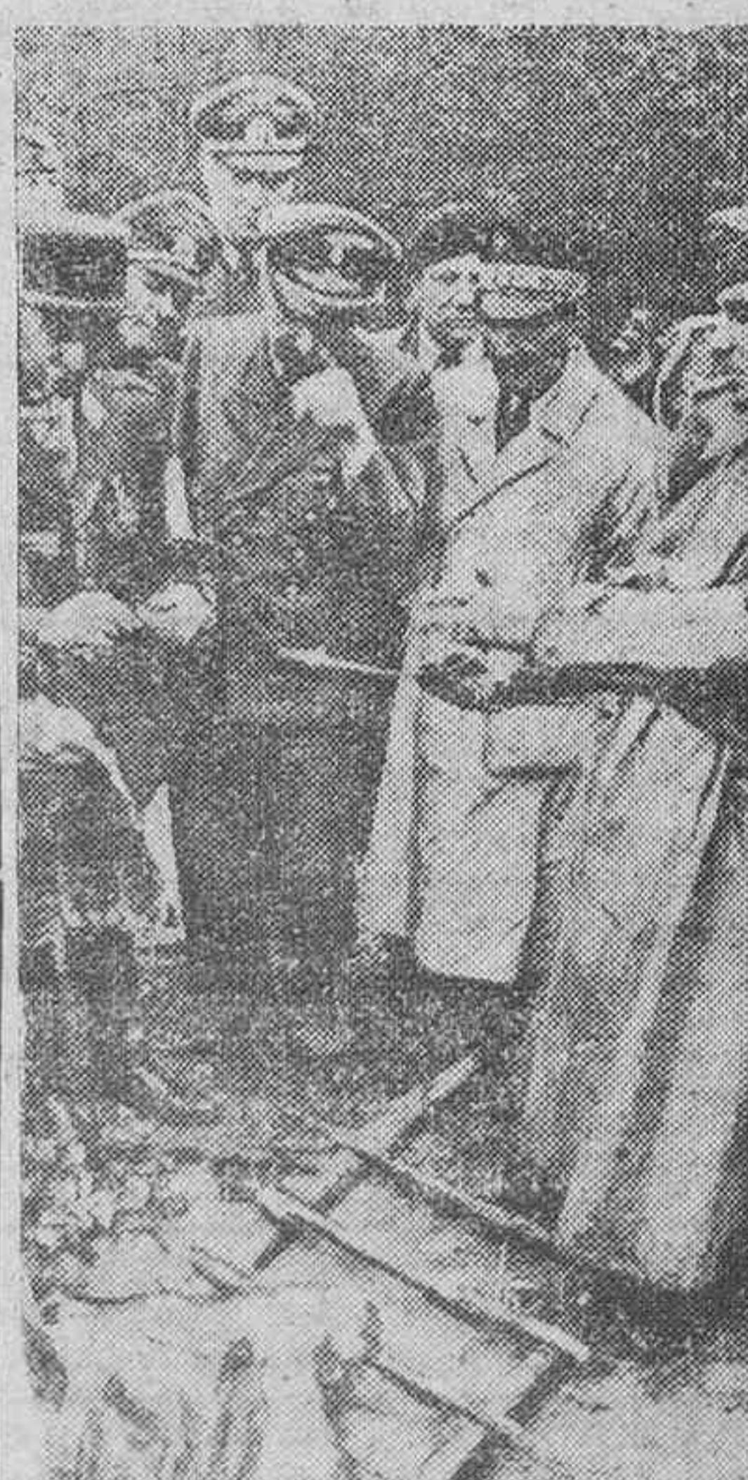
Viaje del embajador de Francia en Berlín, De Brinon, a los enterramientos de Katina.

Una simple llamada al número 1000 y la Sección Femenina pasará a recoger el papel a tu oficina o domicilio.