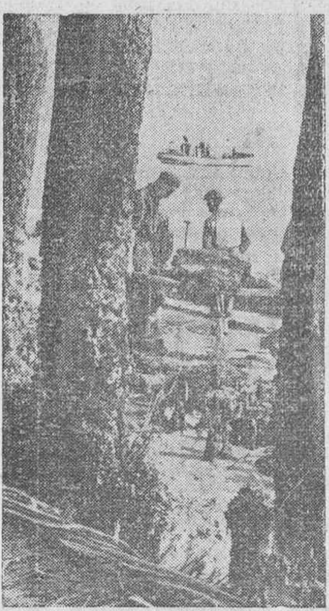
Obreros franceses que bajo la vigilancia de los soldados alemanes se ocupan de reparar los daños causados por las mareas en las fortificaciones.