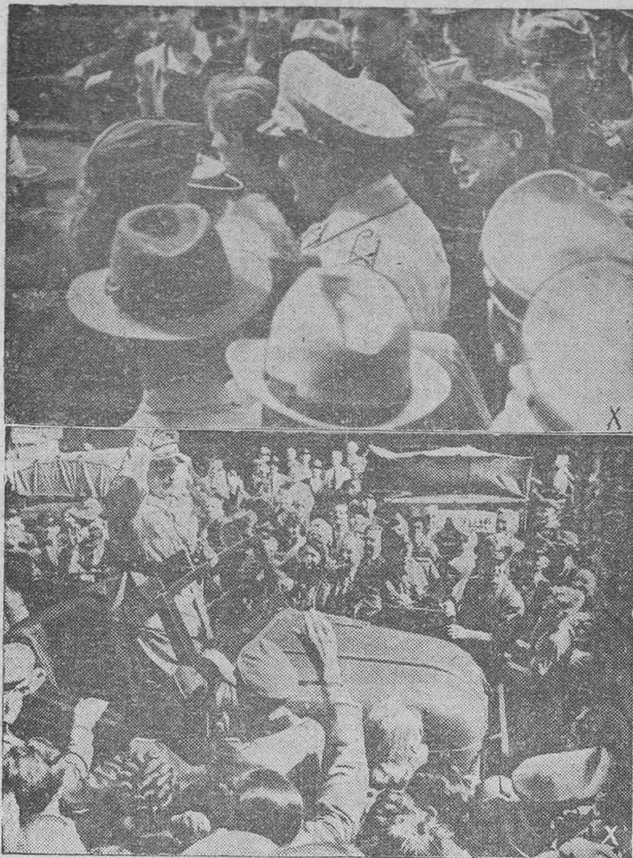
El Mariscal alemán Hermann Goering, a su regreso del Cuartel General del Fuhrer, visita Hamburgo y Berlín, donde las poblaciones le hacen objeto de cariñosos recibimientos.