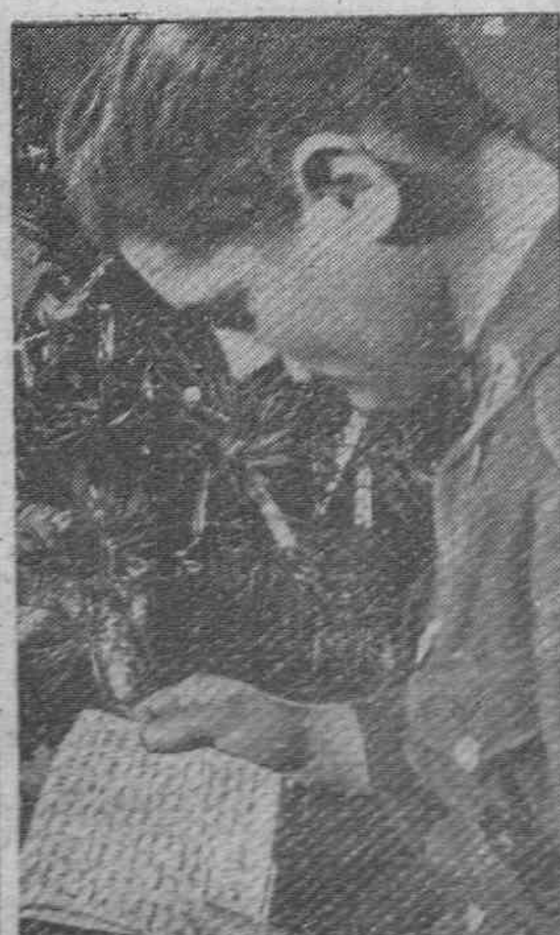
El soldado lee la carta de la Patria junto al árbol de Navidad.