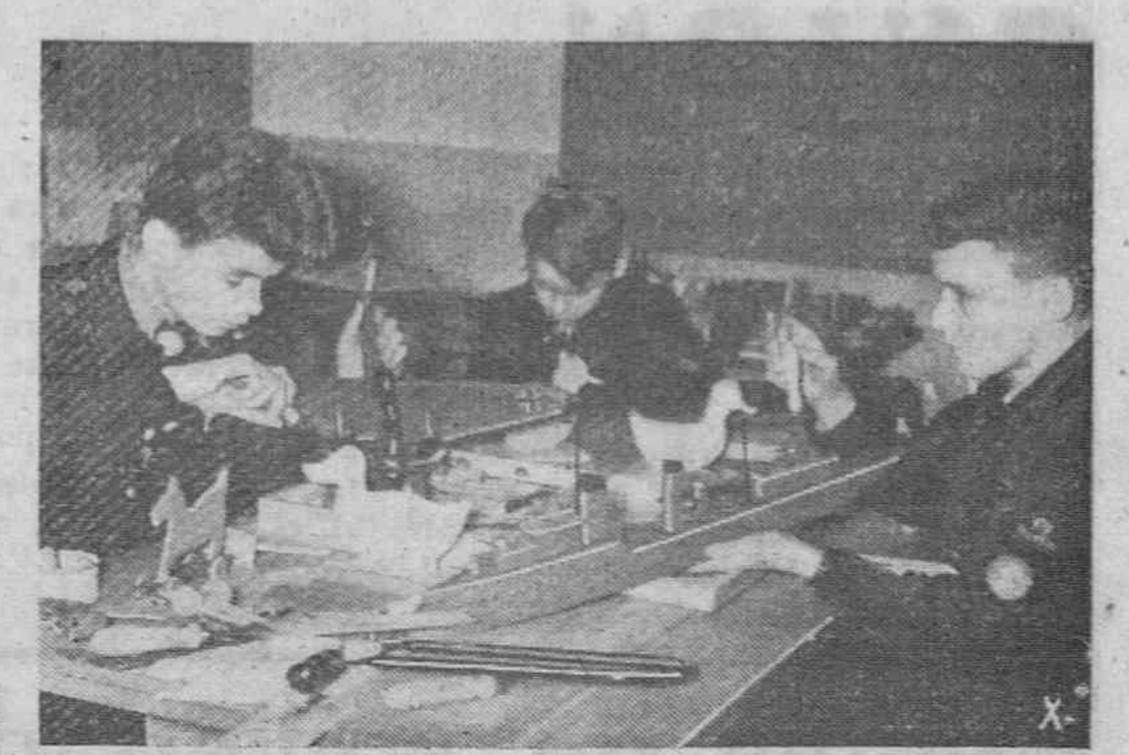
Los niños alemanes fabrican juguetes con que obsequiar estos días a los niños hijos de los soldados.