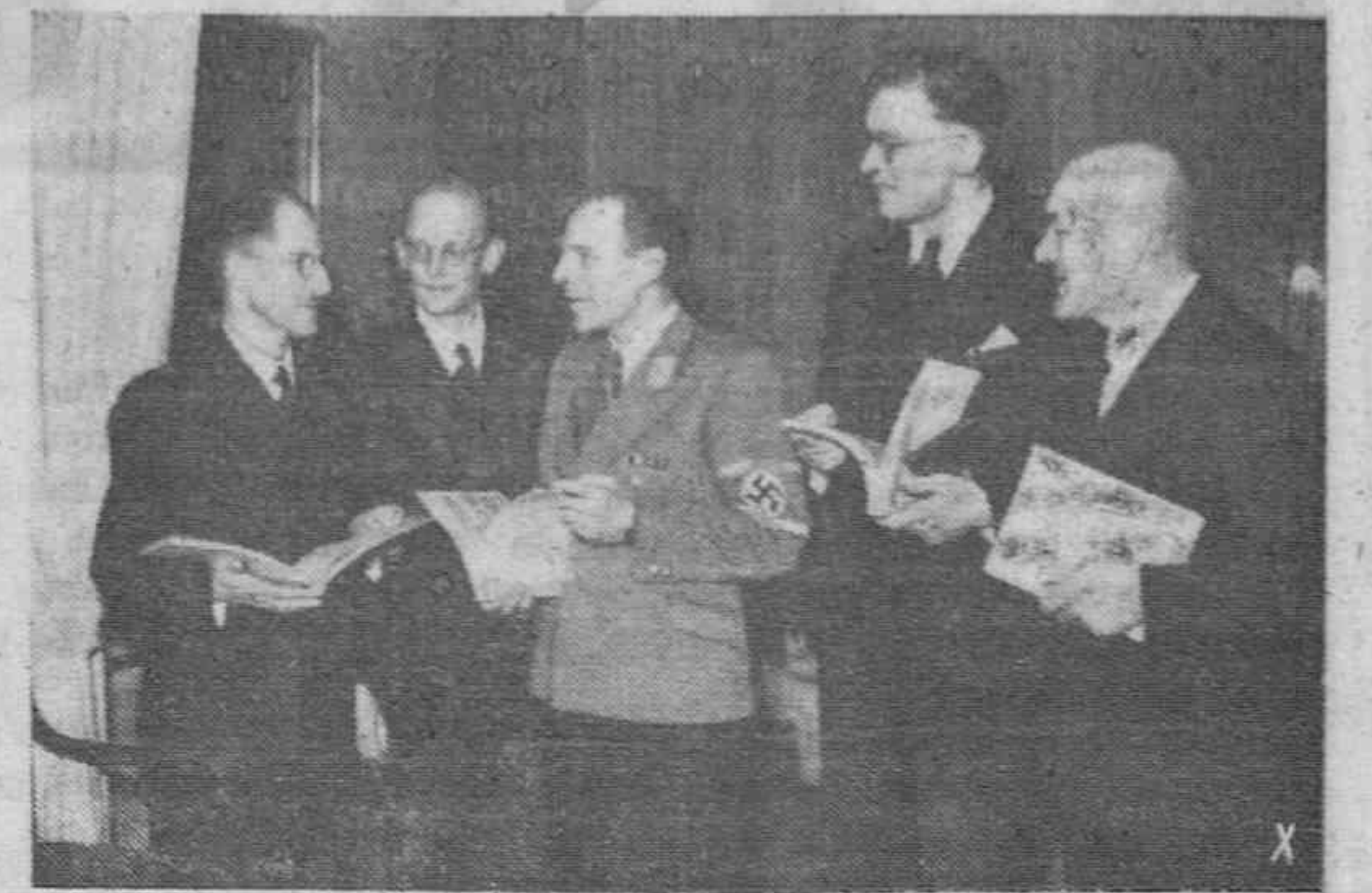
El cuarteto alemán de cuerda "Siemens" recibe un premio y donativo a su labor, por el Departamento de Música del Reich.