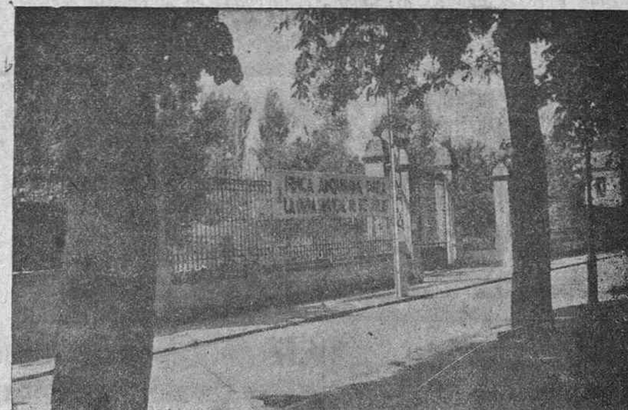
Aspecto del Paseo de Fray Francisco en el que se están llevando a cabo importantes obras de instalación de la gran Clínica 18 de Julio, que mañana serán visitadas por el camarada Arrese