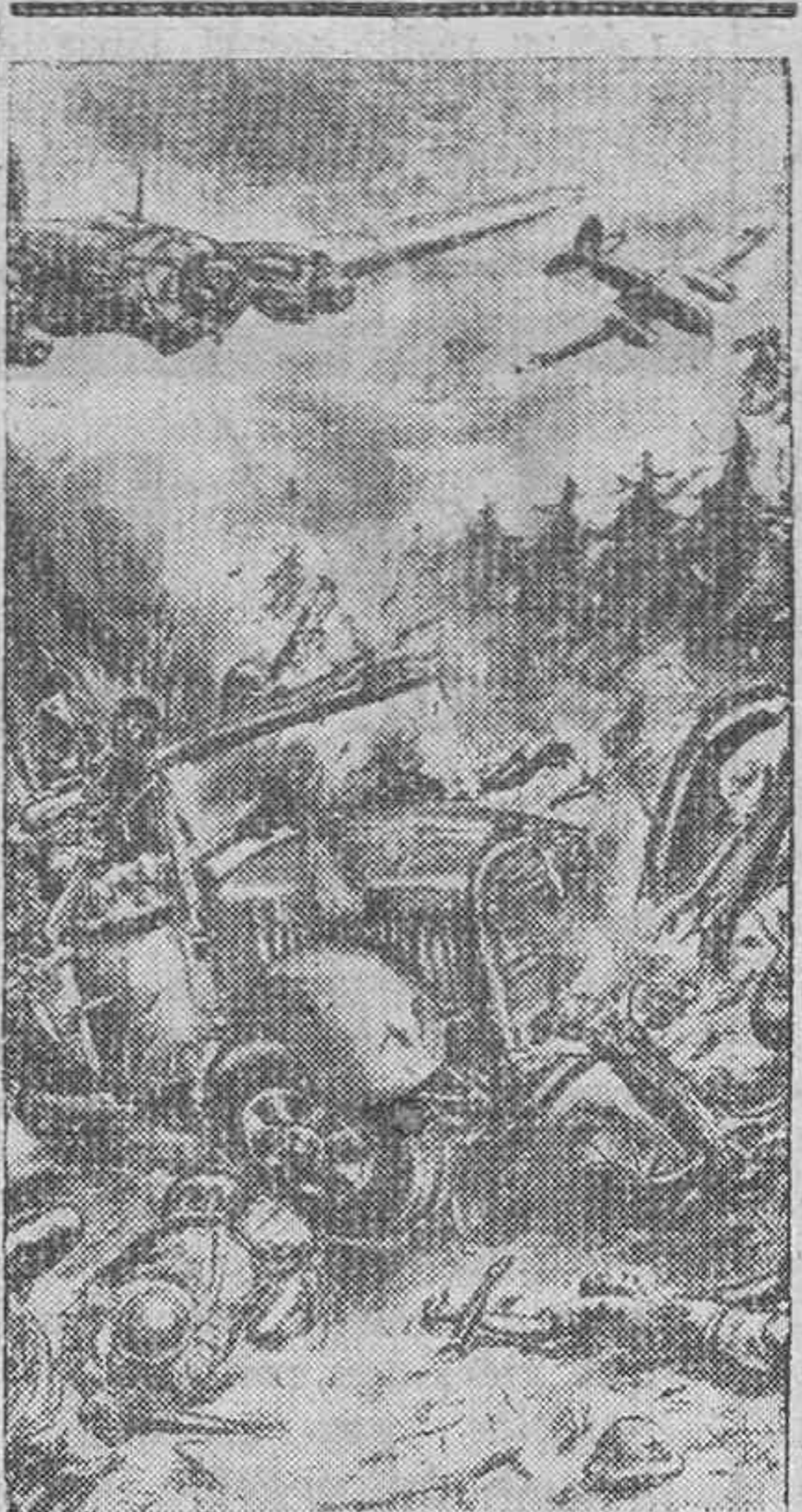
La feroz batalla de Stalingrado vista por el lápiz de un combatiente alemán

Del 5 al 15 de septiembre el soviético perdió 1.215 aparatos, de los cuales 936 fueron derribados por los cazas en combates aéreos, 212 por la DCA, 43 por las unidades del Ejército y el resto en el suelo.