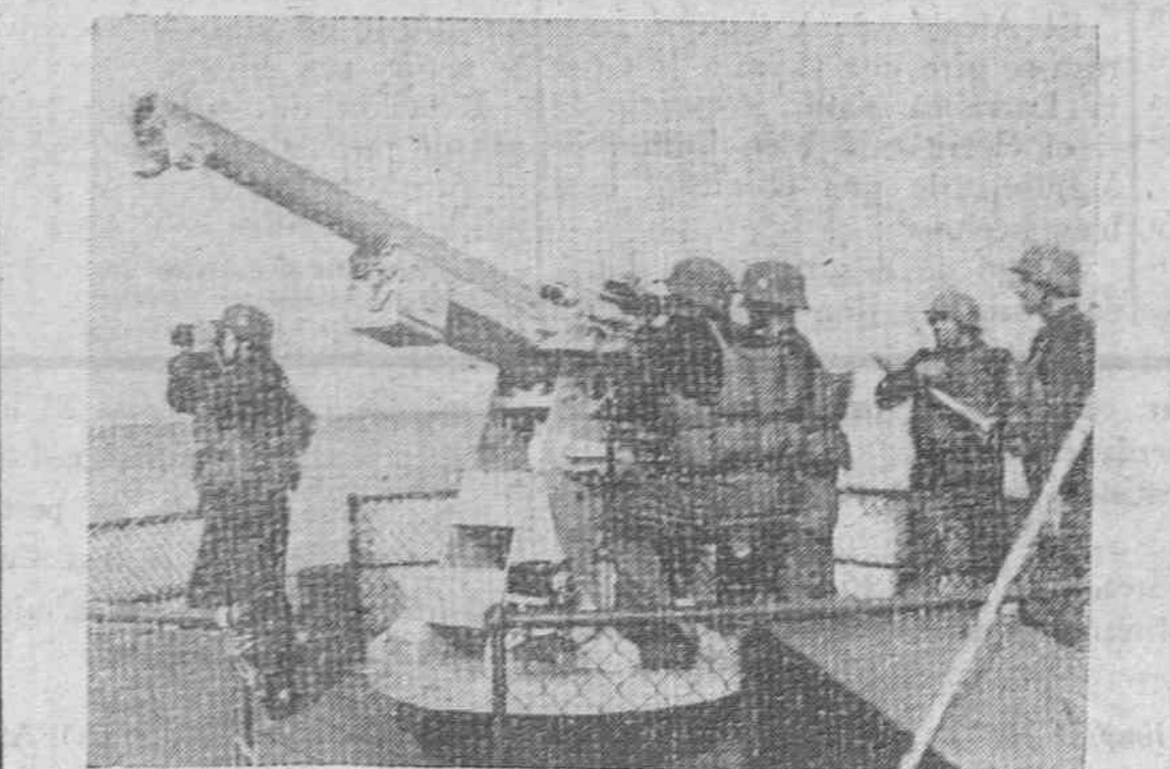
Un patrullero alemán vigilando las aguas del Canal de la Mancha y preparando sus baterías antiáreas.

El público, que llenaba completamente el cine "San Marcos", siguió la proyección con extraordinaria emoción y respeto, siendo aplaudidos los pasajes de mayor interés. El final fué acogido con una larguísima y entusiasta ovación por todo el público, entre el que se encontraban las figuras más destacadas del cine europeo.—Efe.