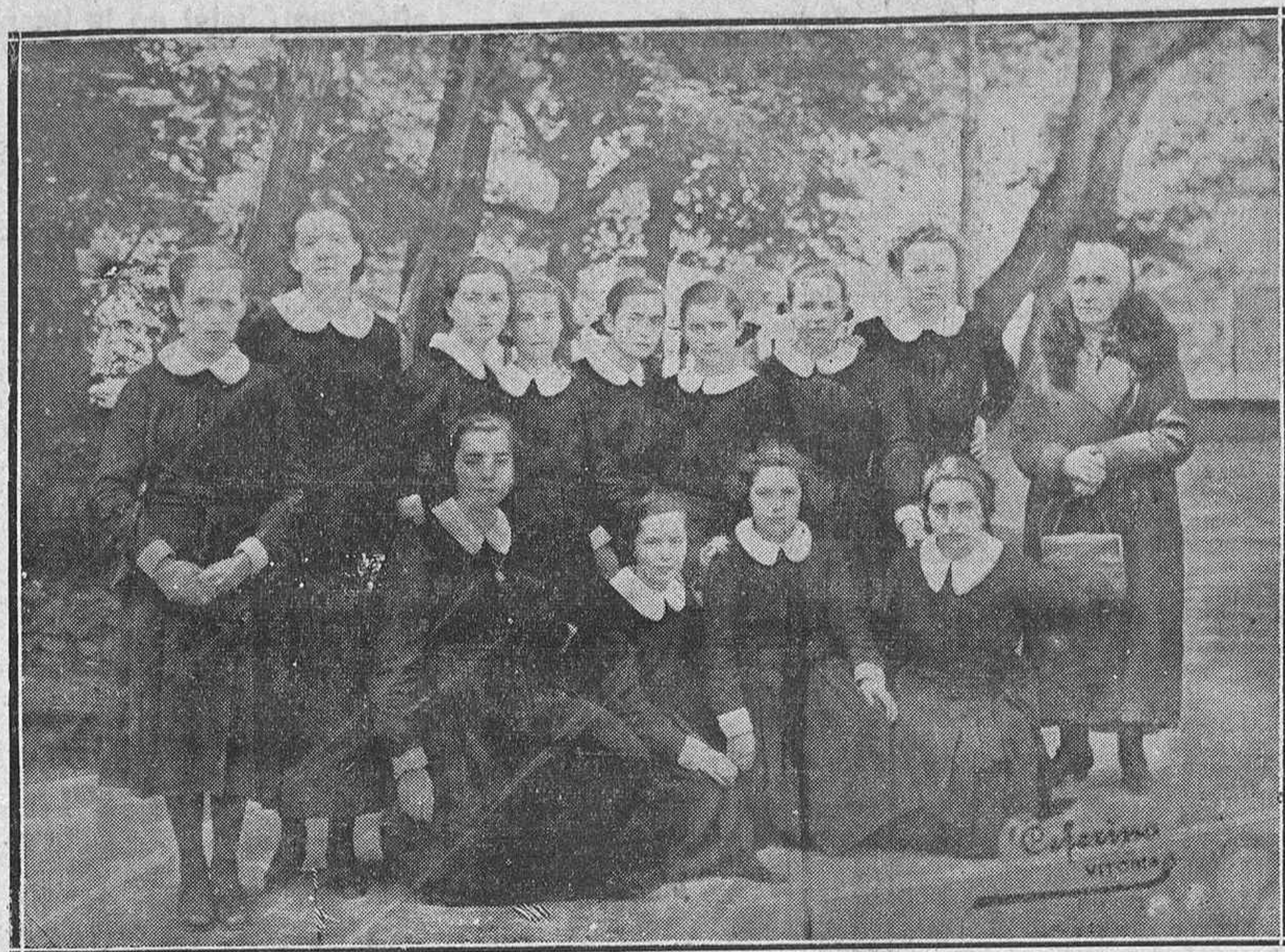
Los exámenes en el Instituto congregan estos días en Vitoria a numerosos estudiantes. Nuestro reportero gráfico ha sorprendido en la Florida este grupo de bellas alumnas del acreditadísimo Colegio de Berriz (Durango)

Lo que esto significa para la economía europea está a la vista. Esto explica quizá, el interés de Inglaterra en liquidar cuanto antes el conflicto de la toma de Abisinia por Italia, con objeto de tener libres las manos. El Japón, a su vez, procura cosechar con la mayor rapidez, para reforzar su posición en contra de Inglaterra y, sobre todo, en contra de Rusia, de modo que pueda hacer frente a todos los acontecimientos.—José Beltrán.