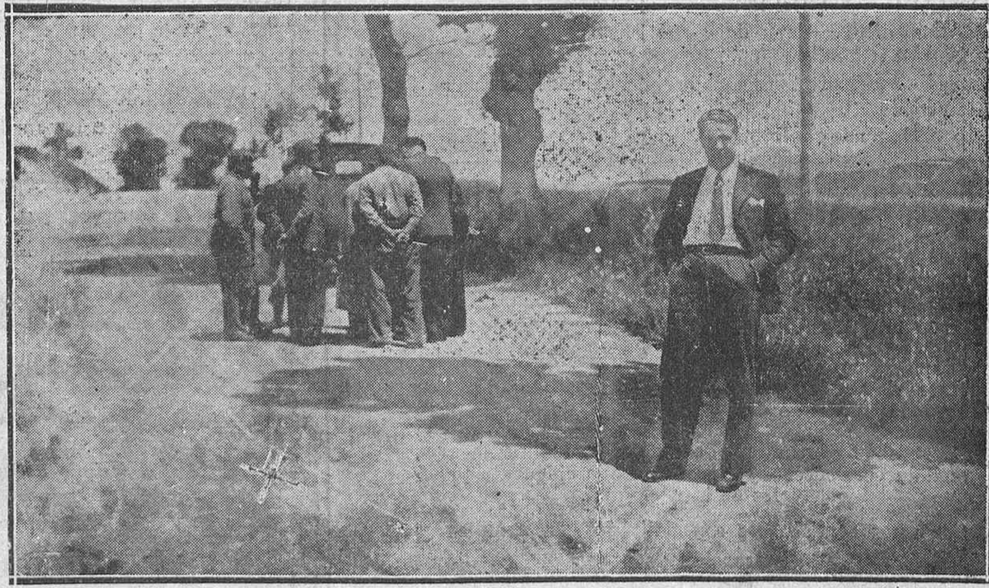
La x indica el lugar exacto en la que ocurrió el accidente del domingo a los dos motoristas, la raya blanca es el surco que hizo la motocicleta al ser arrastrada a la pieza del lado izquierdo de la carretera