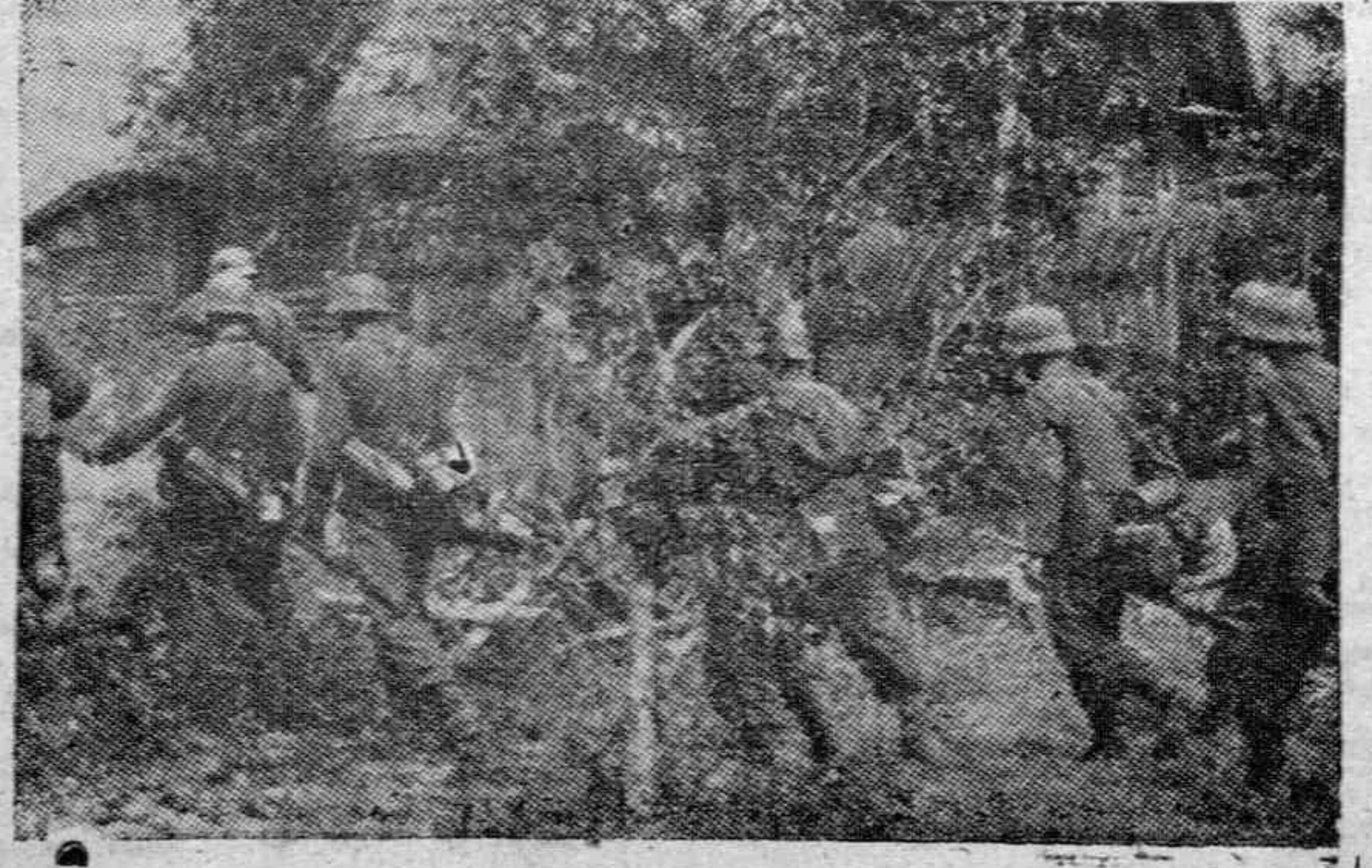
Tropas norteamericanas cruzando un pueblo belga cerca de Lieja.