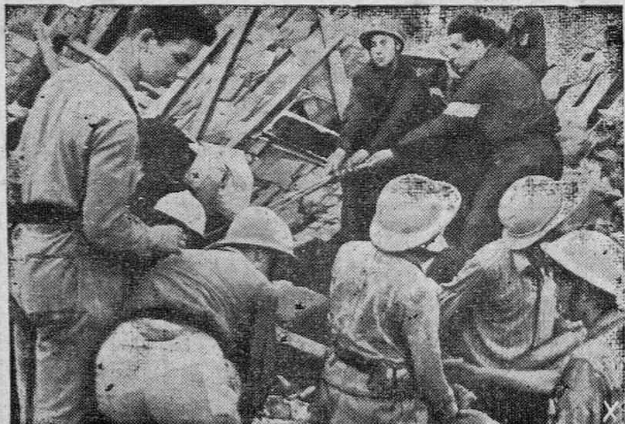
Espesas nubes de humo se elevan de las casas damnificadas después de los bombardeos de que son objeto ciudades y pueblos. Los servicios de salvamento se apresuran después a buscar entre los escombros de las casas derrumbadas las víctimas de la población civil.