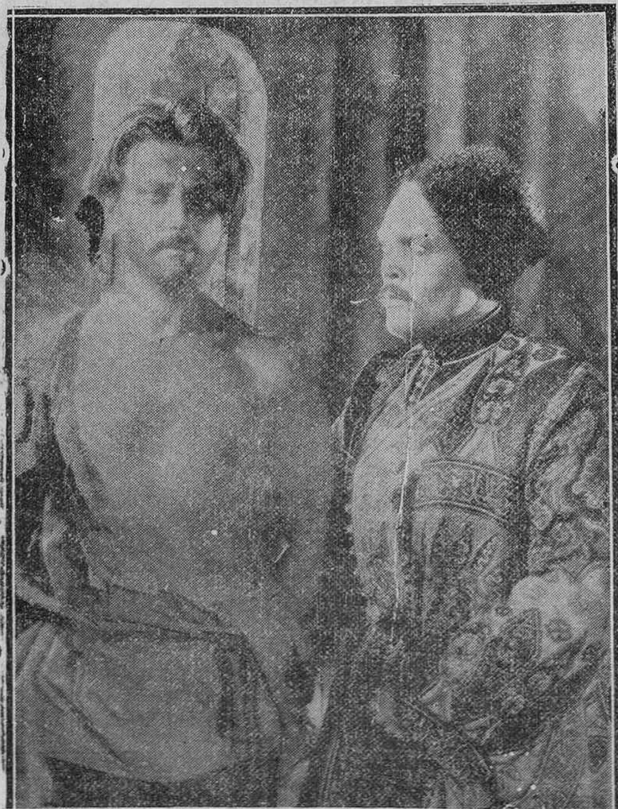
Los dos rusos que actuaban de secretarios del señor Aguirre

Ha salido el primer número del semanario "Pelayos". Lleno de grabados, historietas y sobre todo de buena doctrina, no solo deleitará a vuestros hijos, sino que les formará en los sanos principios que hicieron grande a la España Tradicional.