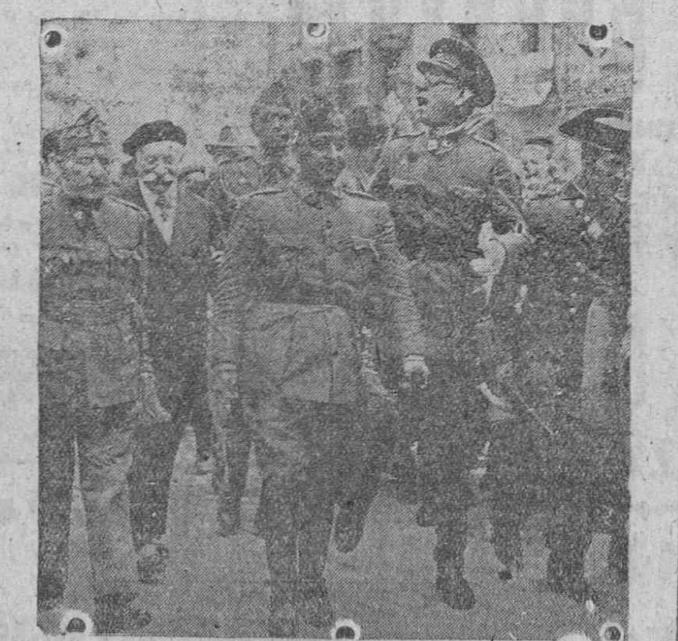
Hoy hace nueve años, en Burgos, la cabeza de Castilla y el corazón de la Patria, en plena guerra de Liberación Nacional, Francisco Franco recibe de los españoles la mayor y más alta magistratura de la nación.