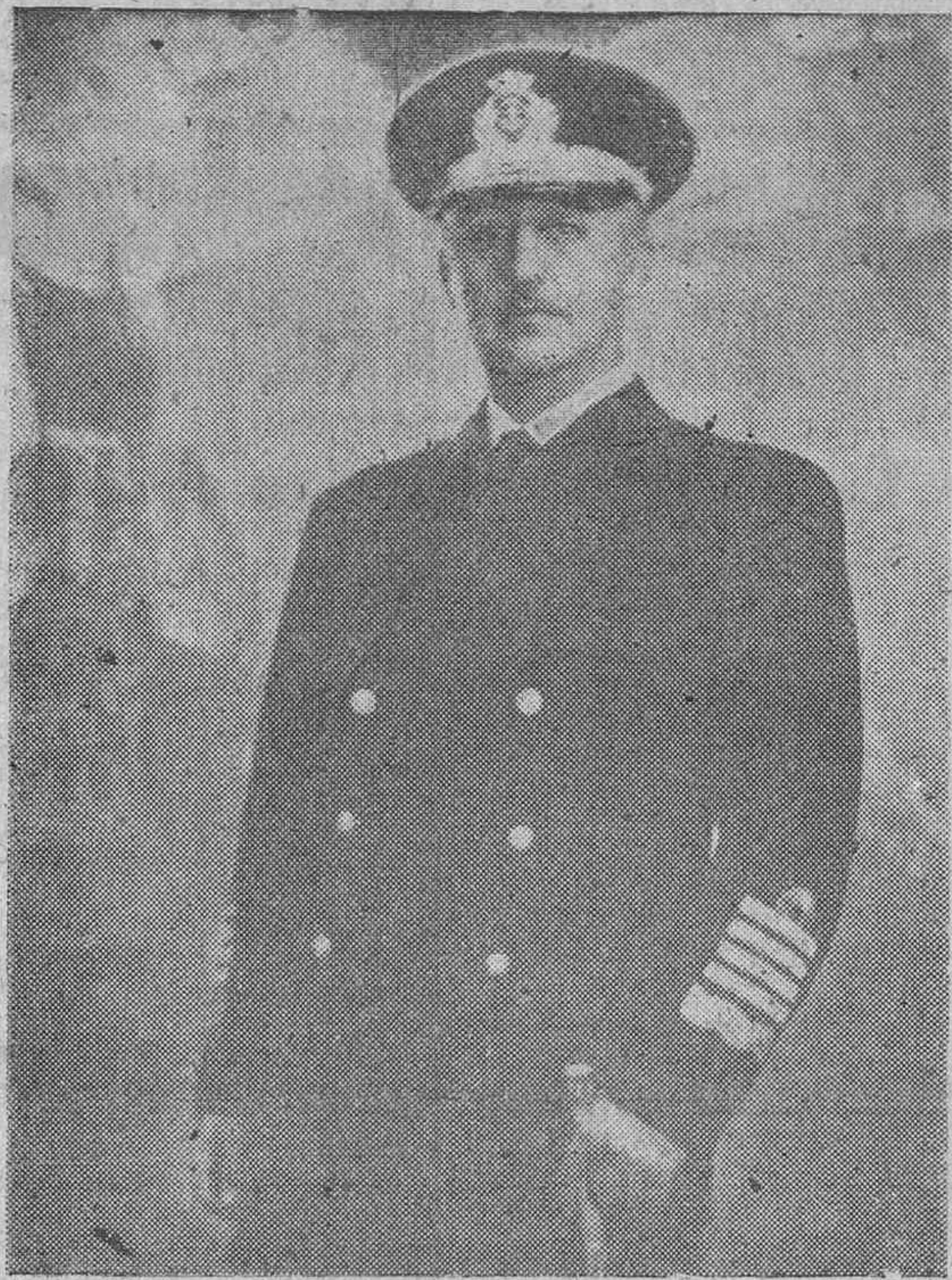
España conmemora en la fecha de hoy el noveno aniversario de la exaltación a la máxima magistratura de la nación del Caudillo de España y Generalísimo de los Ejércitos, Francisco Franco.

Un año más que los españoles han gozado de la paz en las tareas del resurgimiento nacional y del trabajo, en medio de un ambiente exento de dificultades, peligros y angustia universal del mundo agobiado en la crisis de una terrible postguerra.