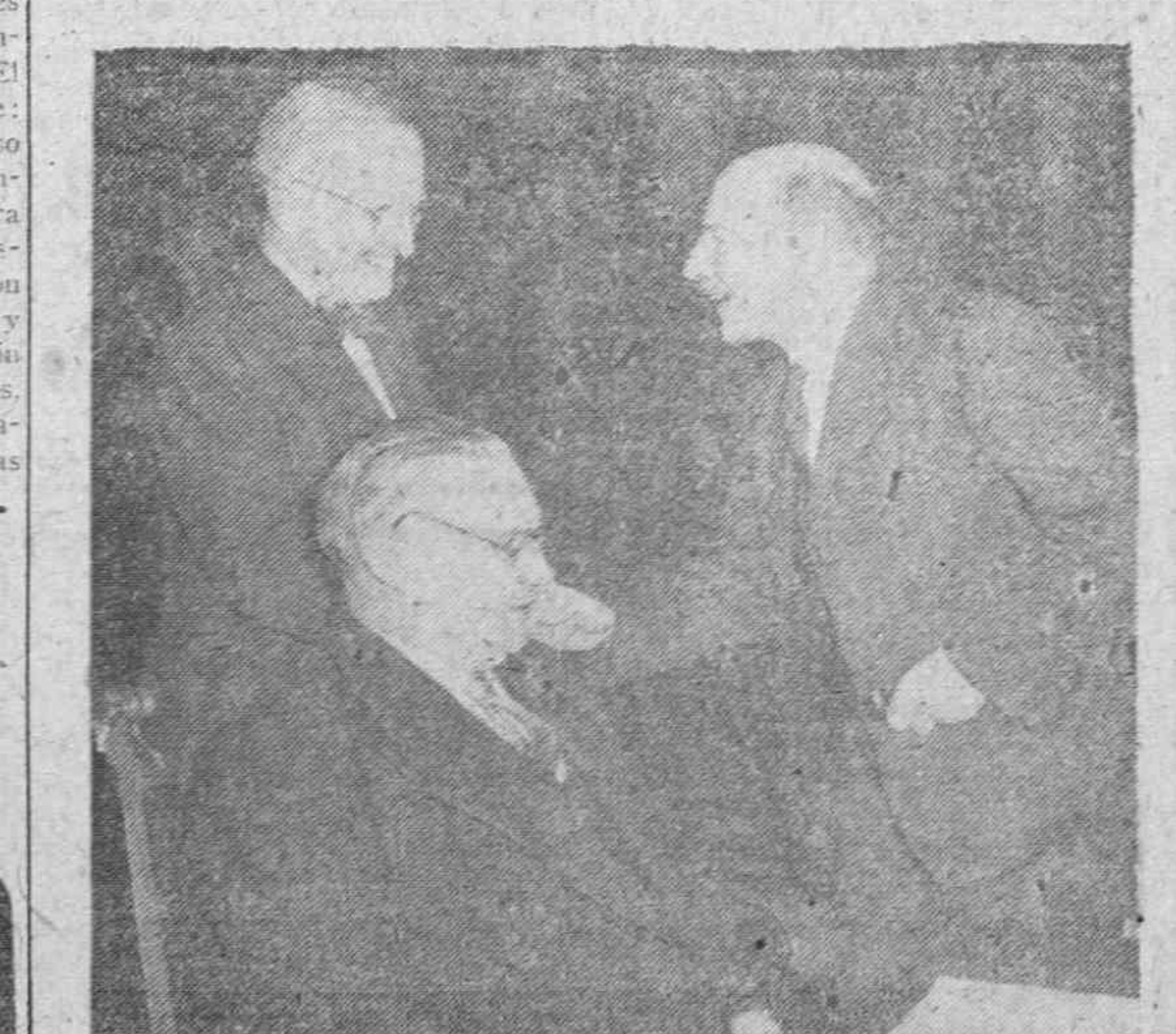
El presidente Truman saluda al primer ministro británico durante su descanso en los debates de la Conferencia de Potsdam.

dieron las orejas de los primeros y se le concedió la del último, saliendo en hombros. Albalicín estuvo muy bien en su primero y mejor en el segundo, con una gitanería y torería magna. Al entrar a matar resultó cogido, teniendo que ser asistido en la enfermería después de llevarse la oreja. El Choni hace una faena inmensa, después de jurarse con el capote, siendo enganchado al dar un pase de pecho. Se le da la oreja y pasa a la embornadura. Pesos: 428, 424, 455, 445 y 554 kilos. —En Hellín, toros de dona Carmen de Federico, que pesaron: 260, 214, 257, 239, 248 y 224 kilos. Manolete, palmas y pitos en el primero y orejas en los otros dos. Aruza se llevó las orejas de los dos primeros y estuvo desahogado en el último. —En Sevilla, segunda de feria, con toros del Duque de Tovar, mansos y desiguales. Armilita estuvo bien siendo ovacionado. Andaluz fué también ovacionado, con petición de oreja. Pesos: 229, 260, 275, 291, 292 y 234 kilos. —En Lorca, corrida de feria, con 65 uado el coque de Pinhermoso. Concitos Cintrón, muy ovacionado, dando la vuelta. Alternaron Domingo, Pepe y Luis Domínguez, que estuvieron muy bien, llevando orejas Pepe y Luis Miguel. Los toros, supriores, dieron un promedio de 260 kilos. Haga usted sus compras y solicite los servicios de los anunciantes de este diario.