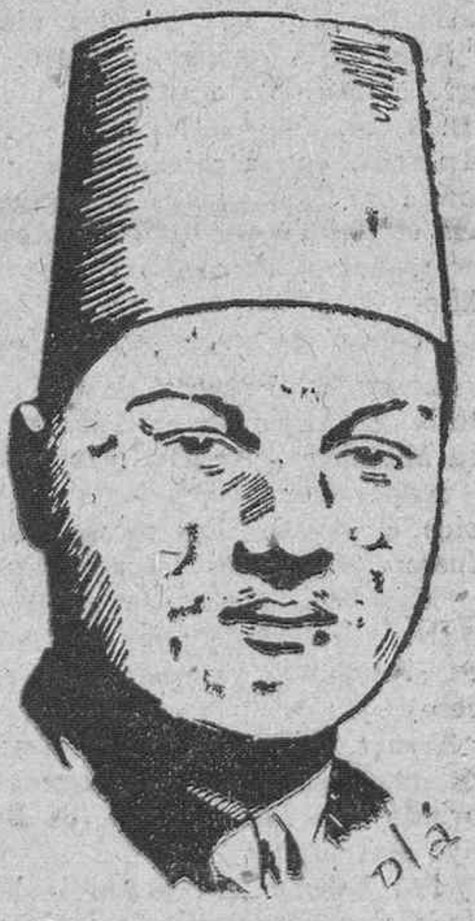
Jeddah.—Ayer mañana llegó a Jeddah el rey Faruk de Egipto, a bordo de su yate Abouf, se anuncia oficialmente.

Si hacemos, por otra parte, un balance de la caridad misionera que ha florecido entre los pueblos católicos, debemos confesar que, aun en medio del ciclón de la guerra, tal caridad tuvo arranques más generosos todavía que en los años de paz.