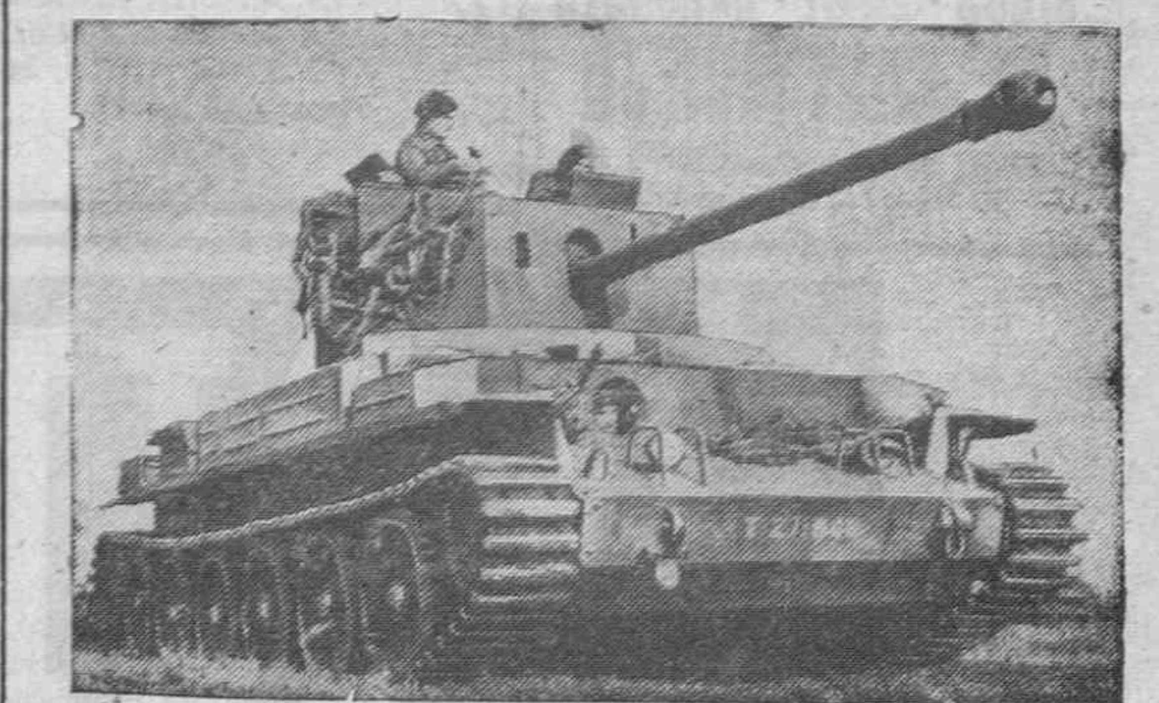
Una vista del nuevo tanque inglés, el "Challenger", que monta un cañón de 75 milímetros.