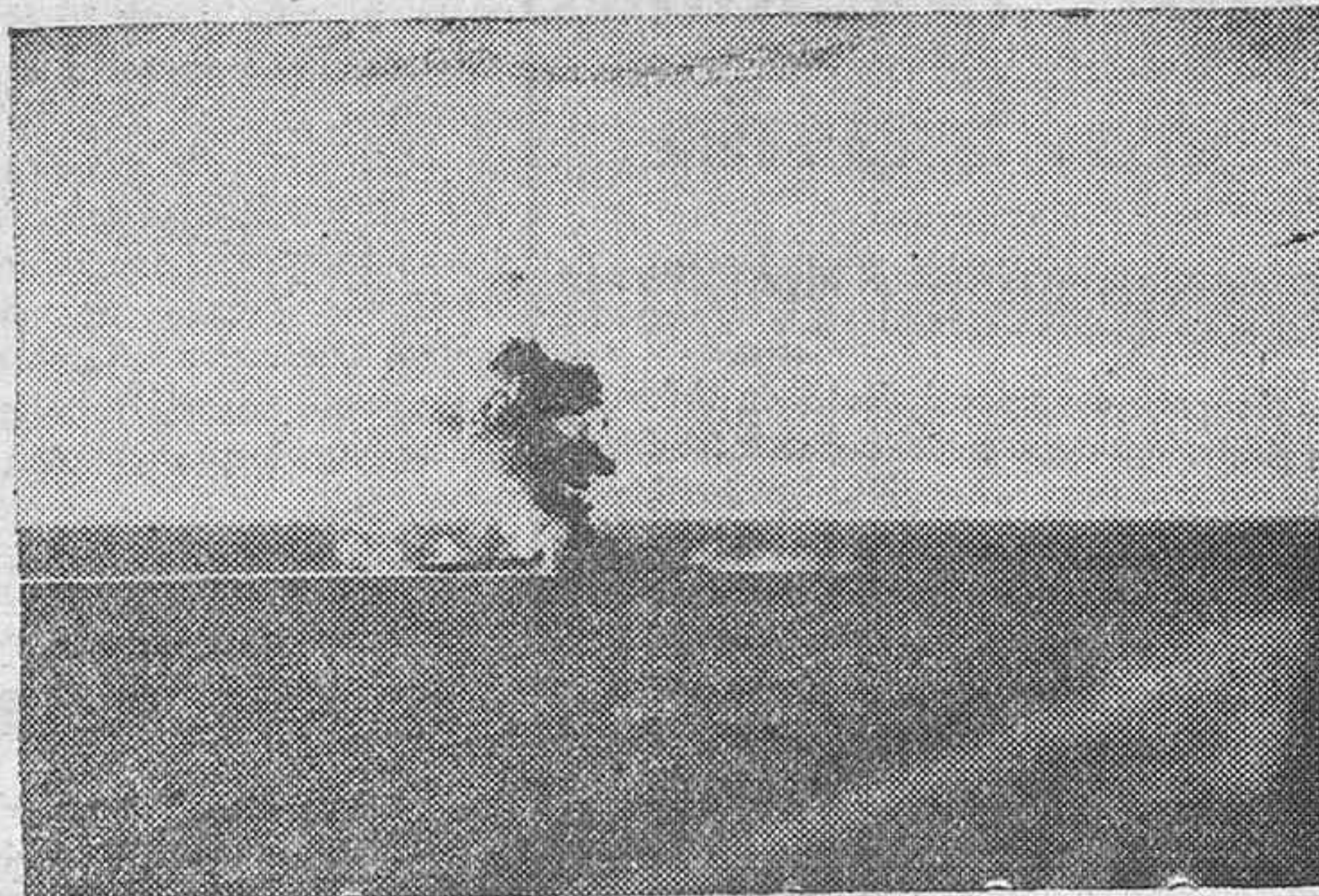
Una densa columna de humo negro se alza del pañol de municiones de un crucero pesao japonés alcanzado por los bombarderos de la Tercera Flota norteamericana.