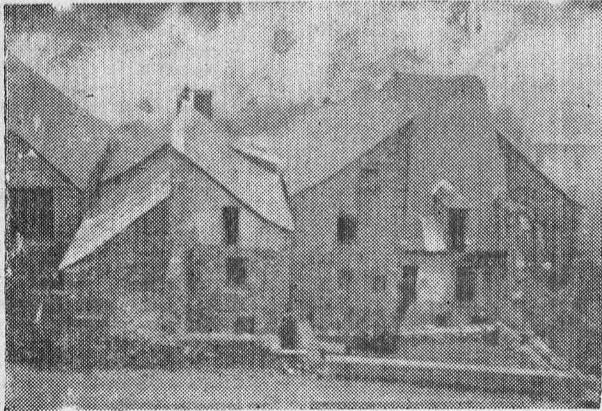
El pintoresco pueblo fronterizo de Canfranc, en los Pirineos, con sus tejados de vertiente, tan típicos en aquellos lugares.

Toda España debe acudir en su auxilio para su reconstrucción