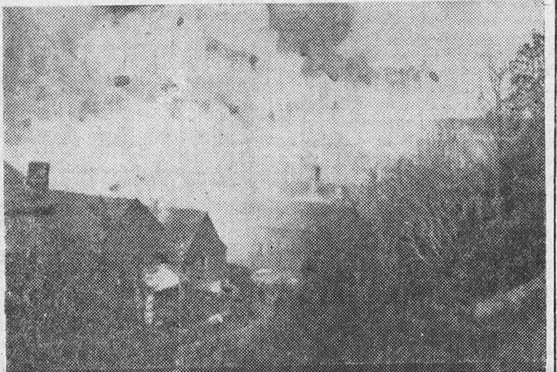
Un aspecto del pueblo devorado por el incendio, que acabó por destruirlo totalmente.

se declaró el incendio, acudieron los Parques de Bomberos de Jaca y Hues-