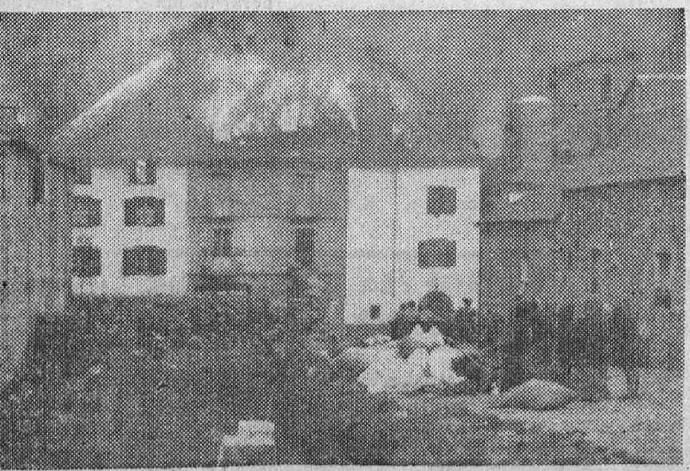
Otra parte del pueblo en la que el incendio prendió, llevando la desolación a sus habitantes.

Canfranc contaba con 900 vecinos y 130 casas, casi todas ellas de moderna construcción dotadas con elementos nuevos de confort e higiene ya que era un pueblo enclavado en un magnífico lugar, excepcional por sus condiciones climatológicas en la estación estival y muy concurrido por los veraneantes llegados de todas las partes de España.