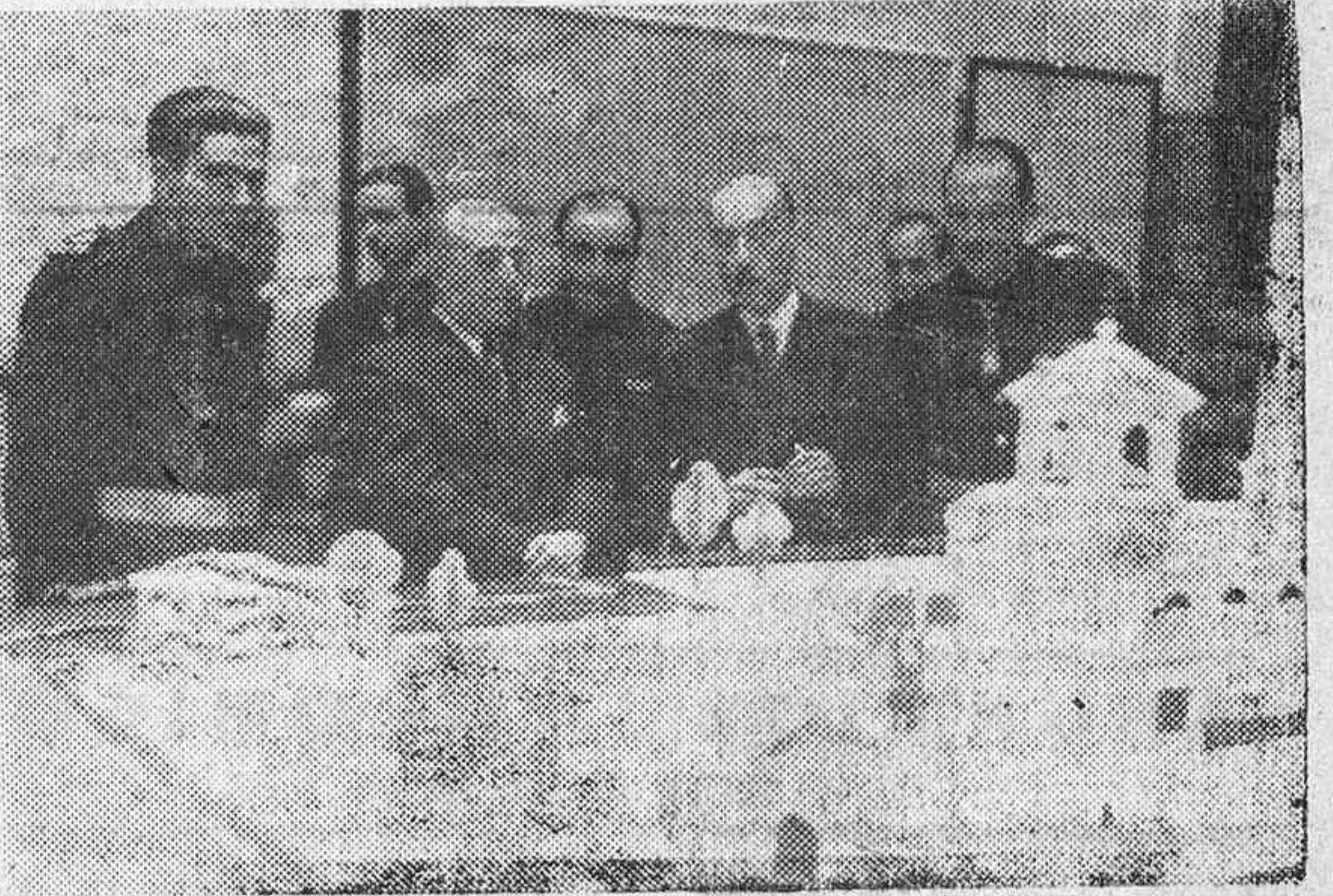
El Caudillo inspecciona la Exposición de maquetas y planos de la reforma de Sevilla durante su estancia en la ciudad capital.