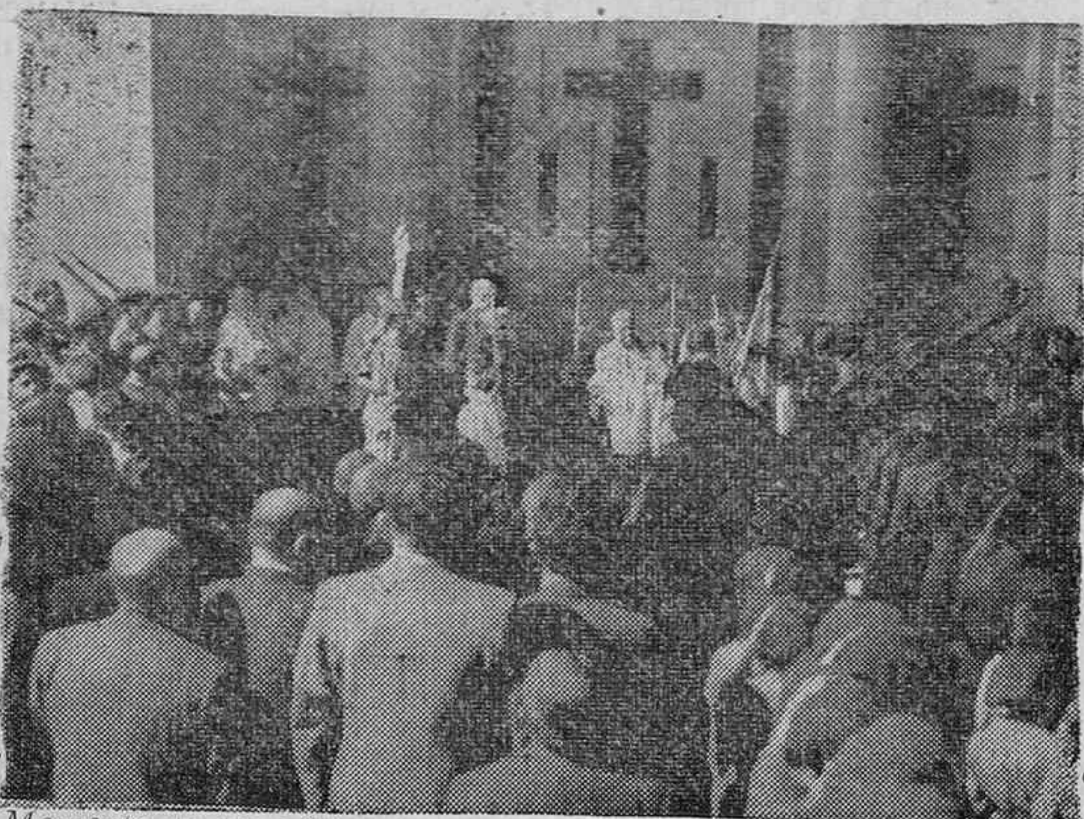
Momento de ser bendecida solemnemente por nuestro Reverendísimo Prelado en el pórtico de la Iglesia de San Miguel, la bandera de las Margaritas vitorianas

Para ayer domingo a las once y media estaba anunciada la bendición solemne de la bandera del Requeté de Margaritas de Vitoria. Poco antes de esa hora nos visitaban los aviones rojos, pero no fueron óbice para que el acto se viese deslucido, antes, el entusiasmo fué mucho mayor.