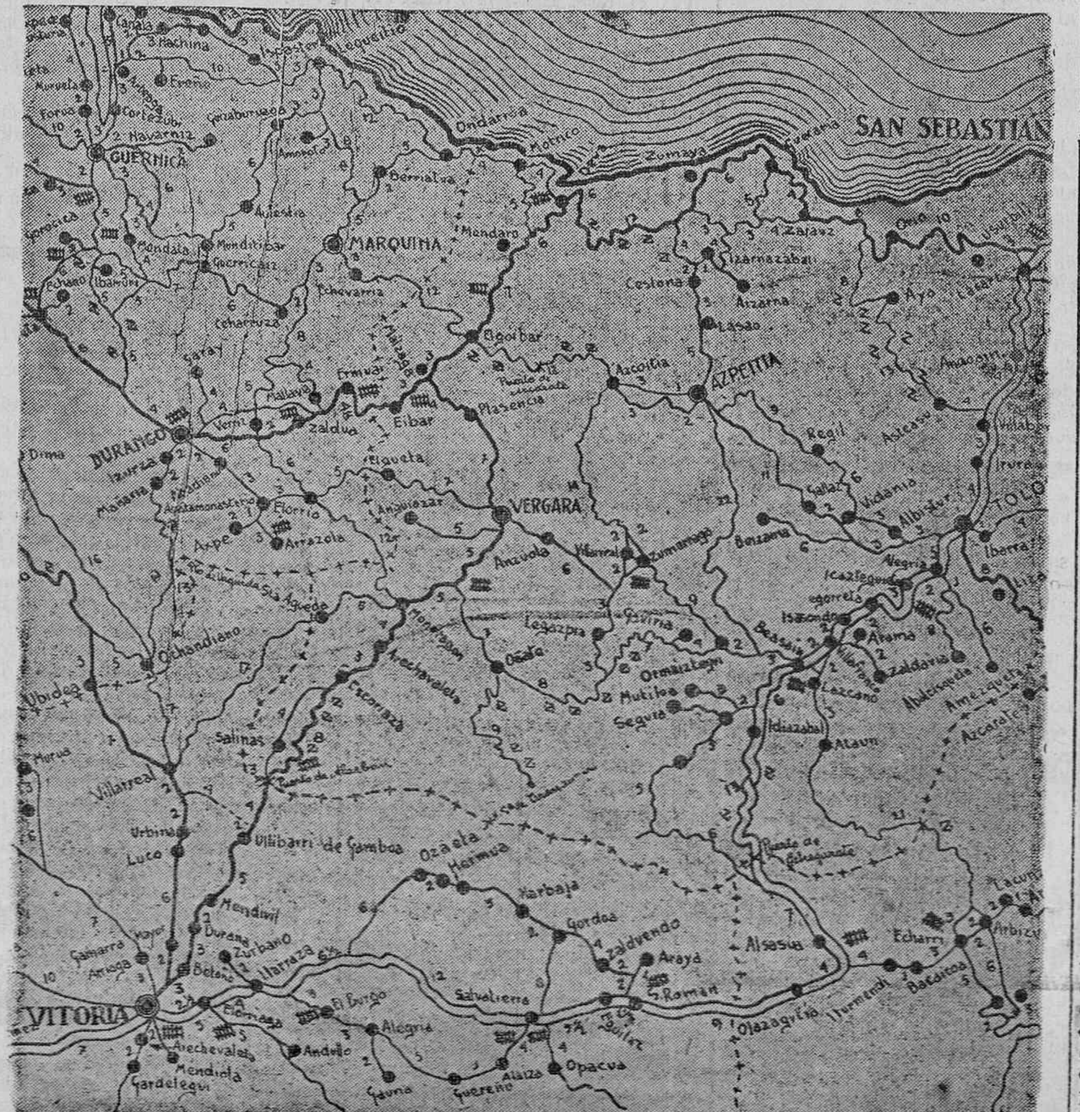
He aquí la parte del mapa de Guipúzcoa donde estos días se están desarrollando las operaciones. Tan arrollador es el avance de nuestras tropas, que han ocupado en pocas horas plazas importantes. Y rumor de haberse ocupado también Mondragón y Vergara. Desde luego, es cuestión de horas la absoluta liberación de Guipúzcoa, que ya está virtualmente realizada, a falta únicamente de la zona fronteriza con Vizcaya

¡Gloria a los mártires de España! ¡Elevemos una fervorosa ora-