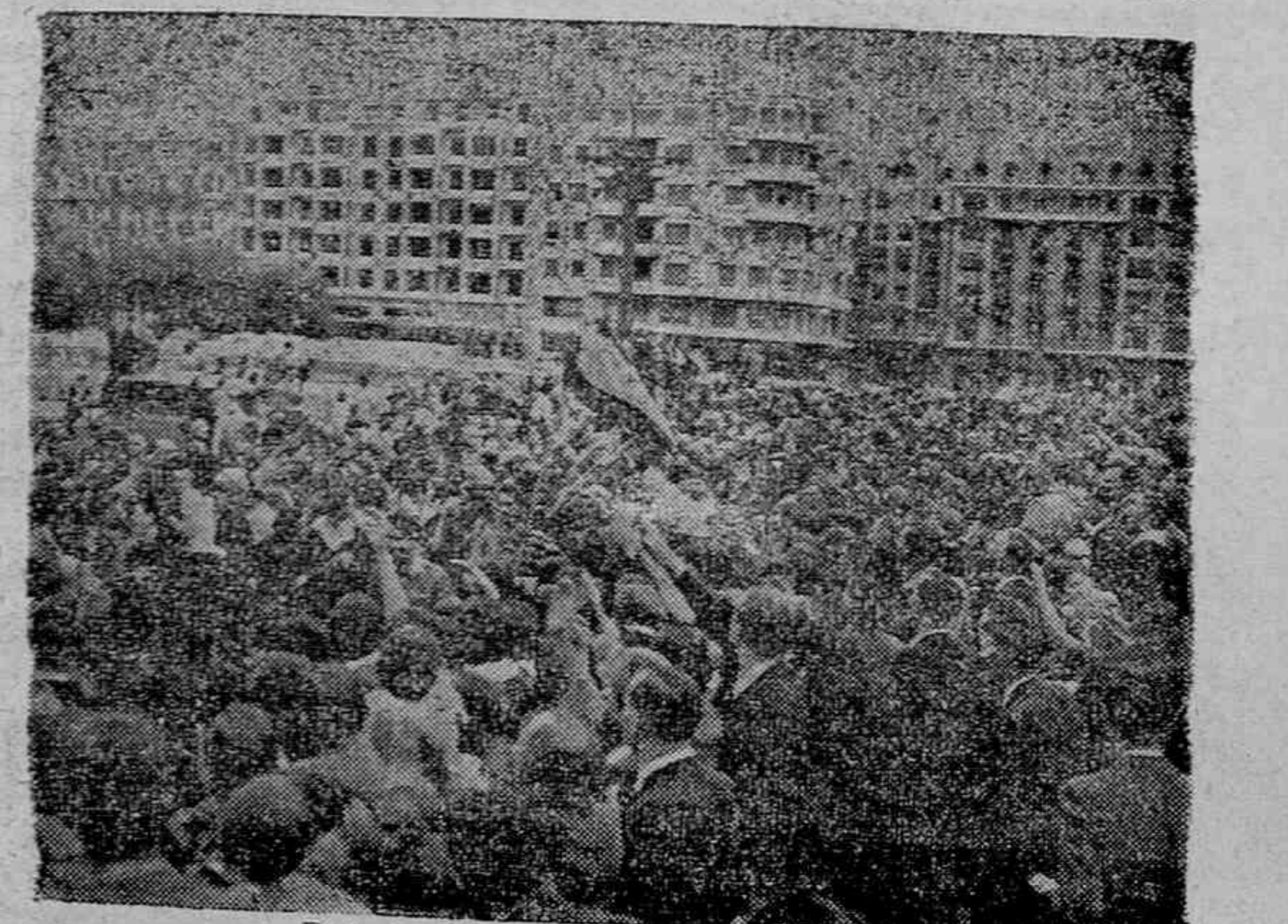
Del desfile de ayer en San Sebastián

En San Sebastián se reanuda el romance del Bello Amanecer.