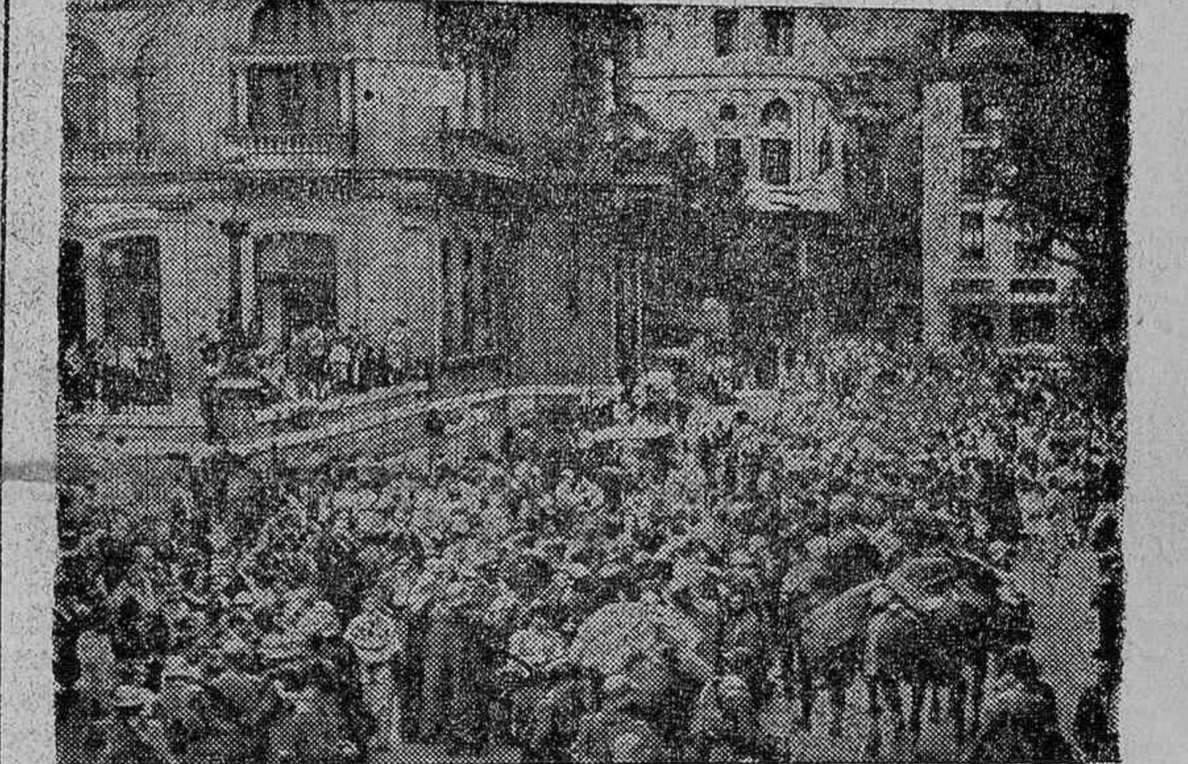
Público delante del Casino de San Sebastián esperando el desfile de ayer

Y los paladines se acercaban. Un ramillete—muchos ramilletes—de mujeres bonitas, ponía una estrofa de poesía en el caldeado ambiente de patriotismo desbordado. Y a su lado un sinfín de gen-