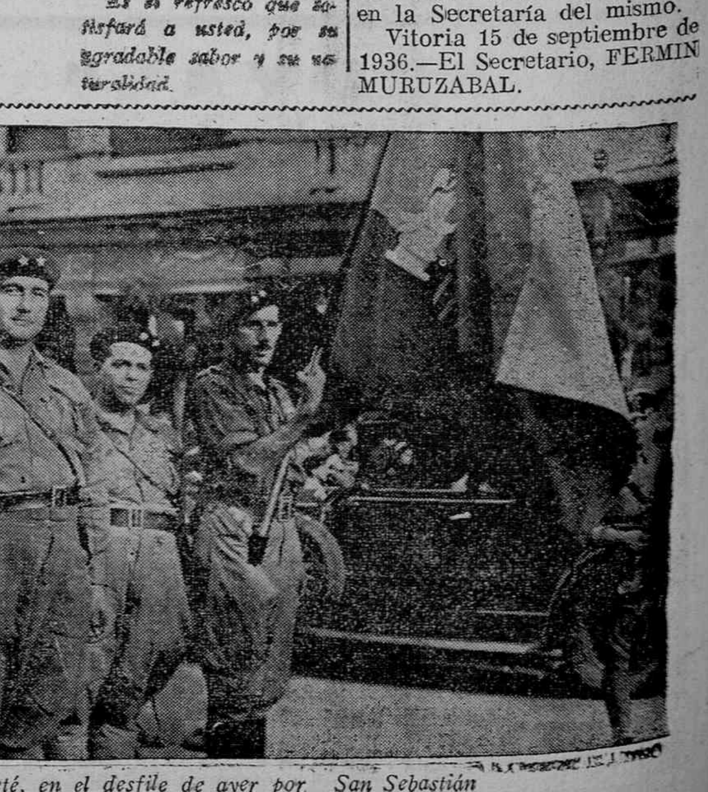
La bandera del Requeté, en el desfile de ayer por San Sebastián