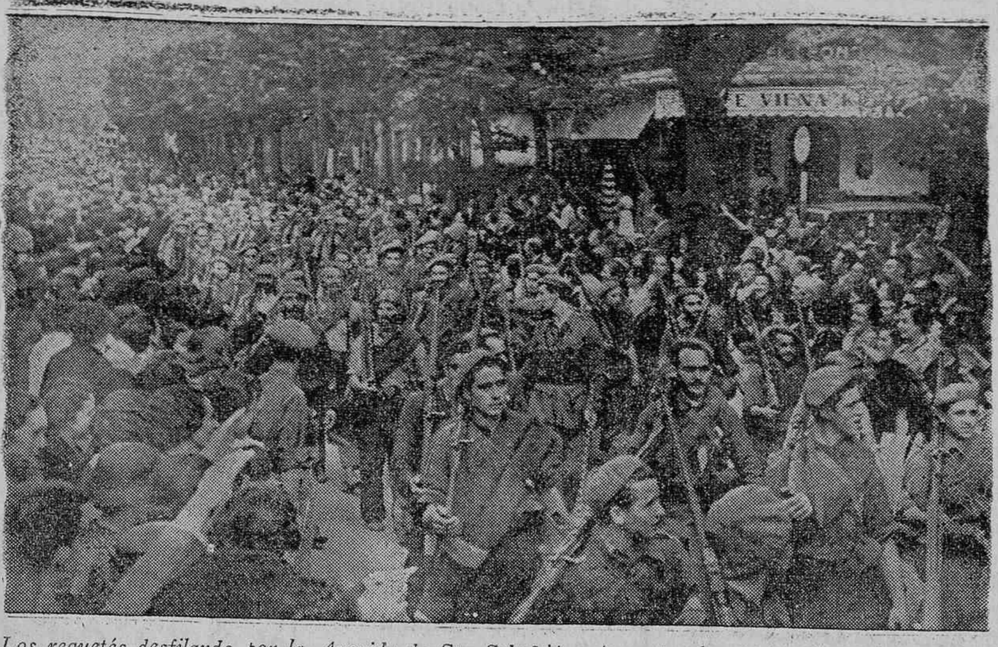
Los requetés desfilando por la Avenida de San Sebastián ayer ante el entusiasmo del pueblo donostiarra