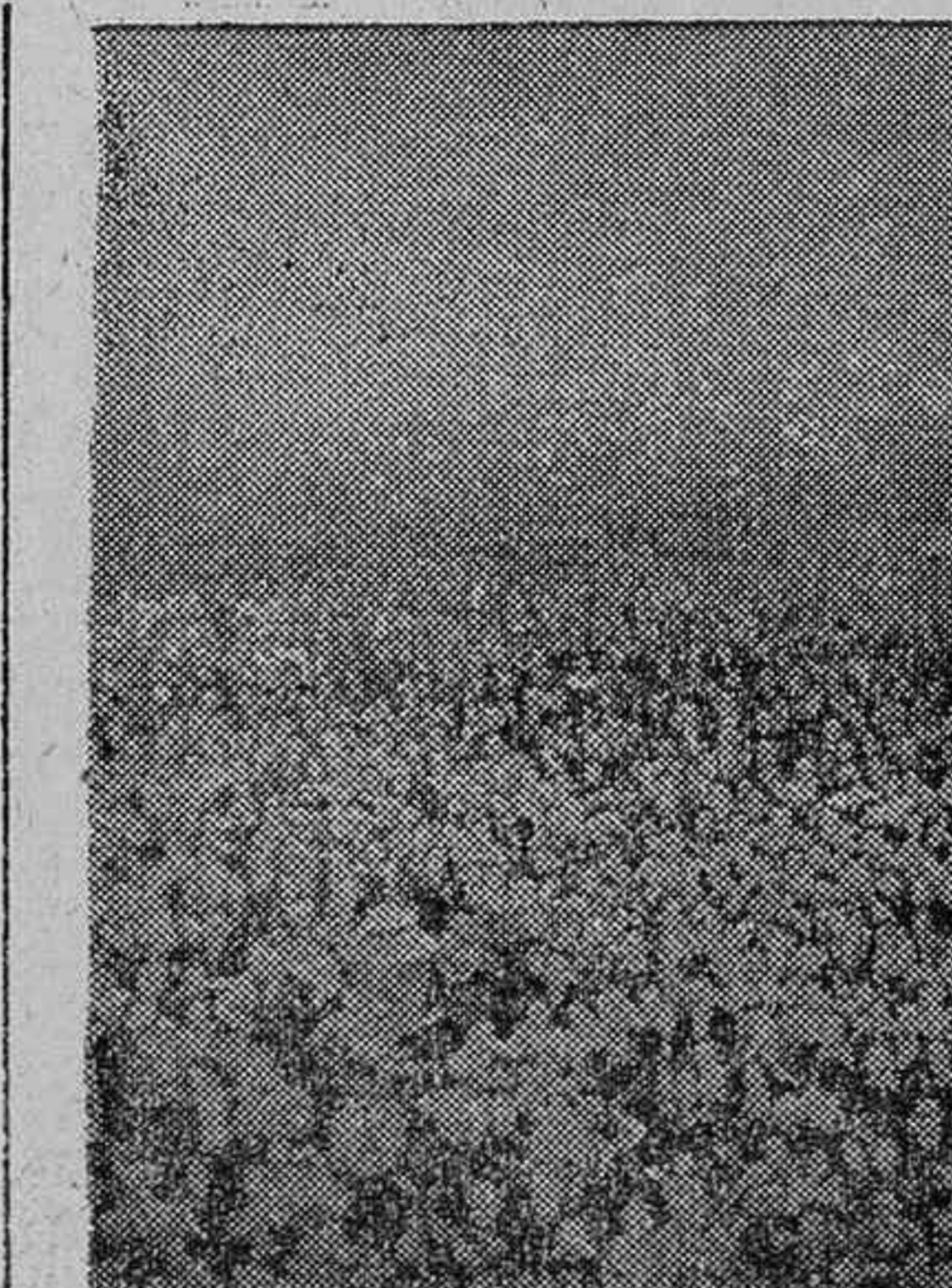
Aspecto parcial del público frente al Gobierno civil de Guipúzcoa ocasionando a los requetés que primero entraron en San Sebastián

Se advierte a las familias de los Requetés que combaten en el frente Norte, que en lo sucesivo han de dirigir los encargos y correspondencia a Braojos (Madrid), único punto en que se encuentran actualmente sus familias res.