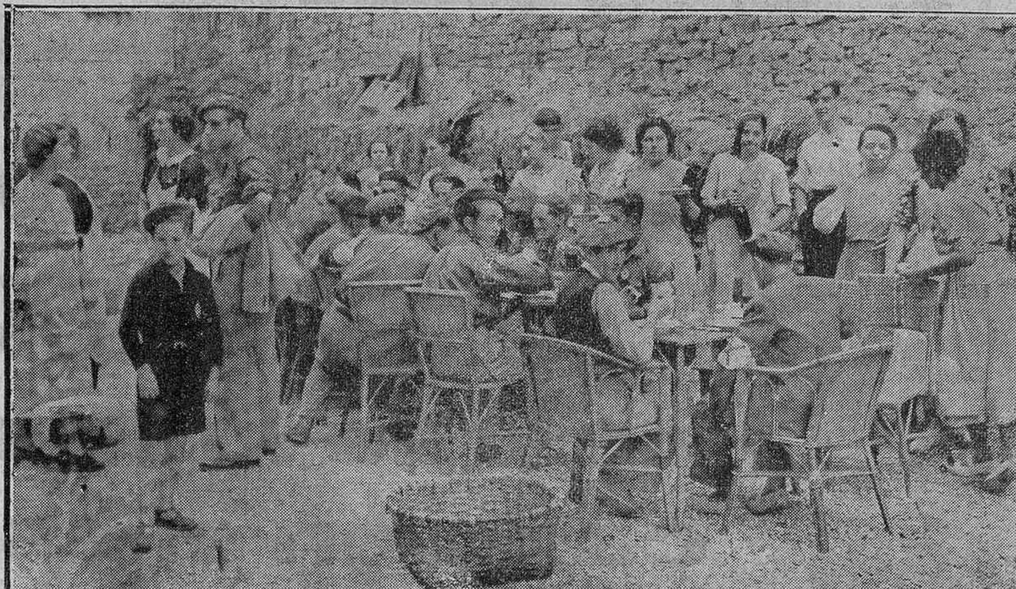
Este triunfo magnífico de España sobre Moscú que todos estamos presenciando, se debe en gran parte a esos voluntarios valerosos que en grandes masas ofrecen sus vidas al servicio de la Patria; y a esas bellísimas muchachas que colaboran a su esfuerzo, con un entusiasmo y con una constancia que constituyen el mejor elogio de estas mujercitas. Damos aquí unas fotografías de Alberto S. Koch tomadas en el patio de Hermandad Alavesa, a la hora del rancho. Un rancho espléndido, como se merecen estos soldados de la Patria.