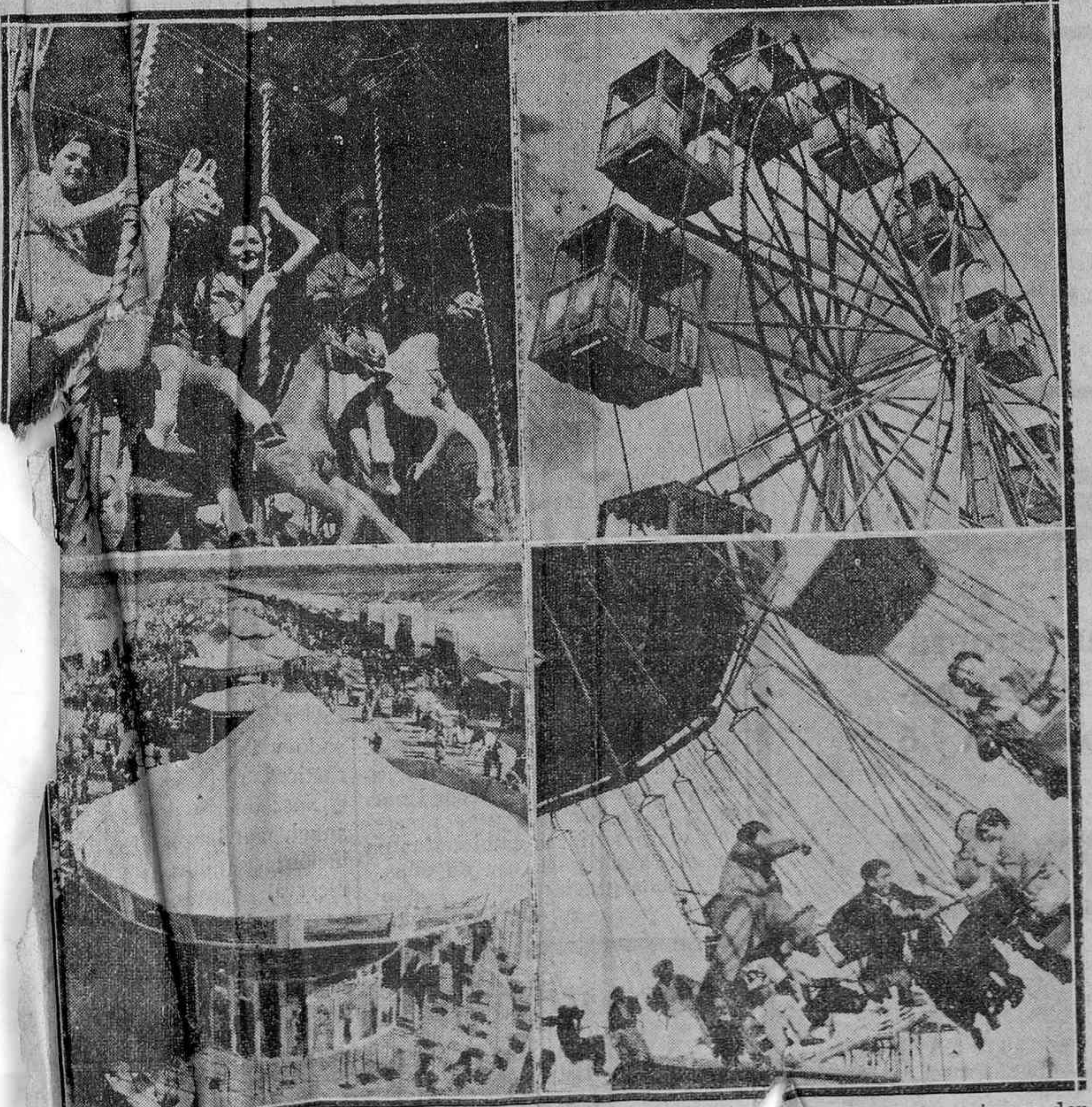
Par de semanas faltan para las fiestas de la Blanca y como de unos días se verá nuestra Florida animada por la poliorama y demás espectáculos de feria (De "Mundial")

A esta Misa quedan invitados todos los católicos vitorianos. Y esperamos que la concurrencia sea tan numerosa como se merece la memoria del gran español, villanamente asesinado por una partida de cobardes.