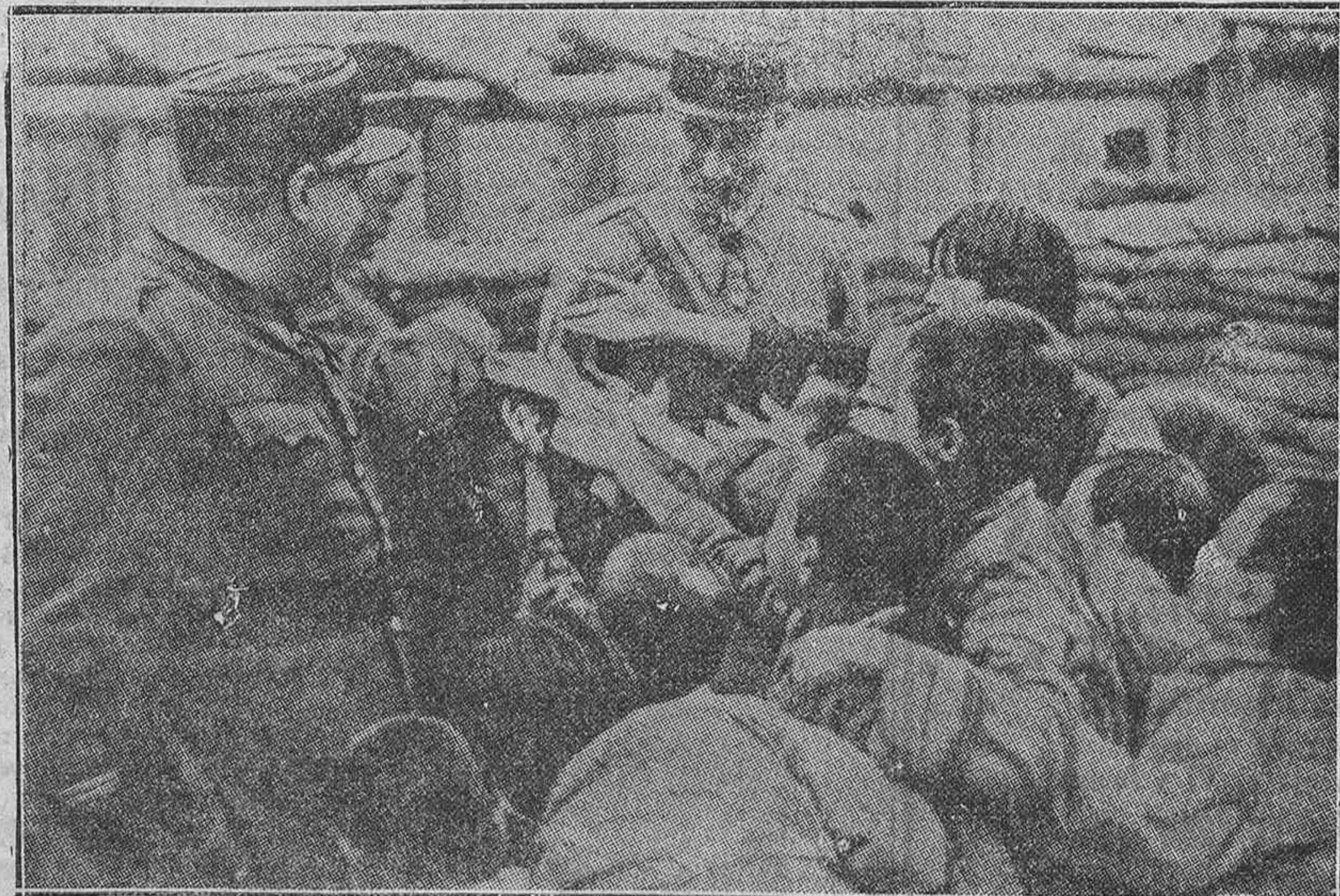
En todas partes igual. Los comunistas chinos, como los de la España roja, prefieren matar de hambre a la población, antes que someterse al imperio de la justicia y de la ley. La foto representa un reparto de viveres entre los refugiados chinos de Shanghai.