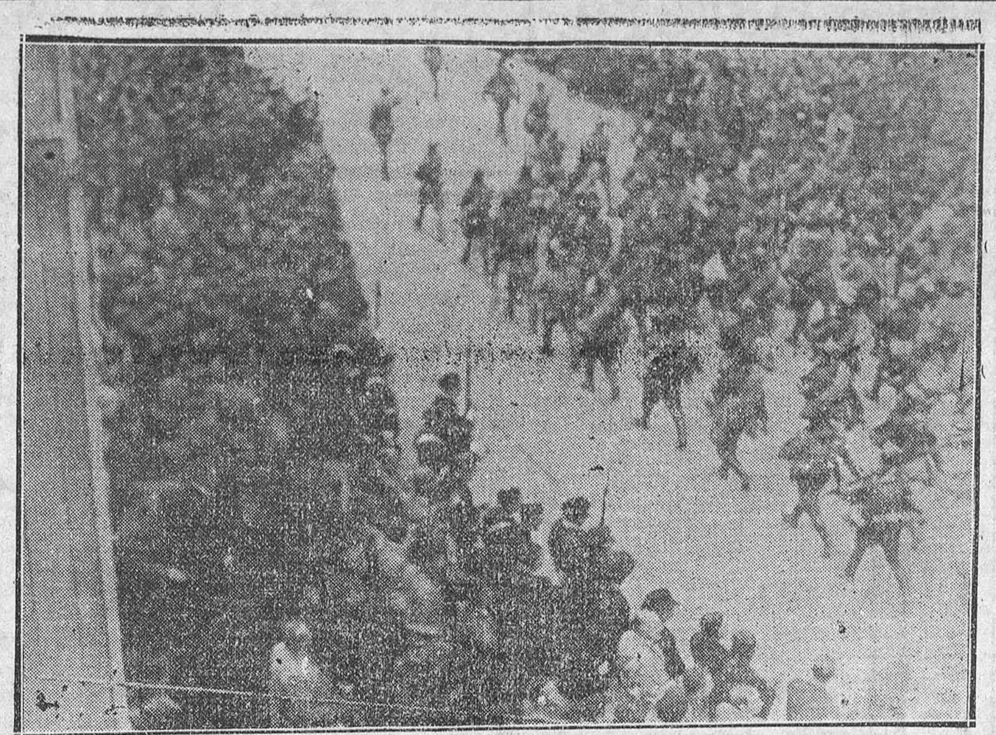
Una vista de los emocionantes actos patrióticos de ayer en Vitoria.