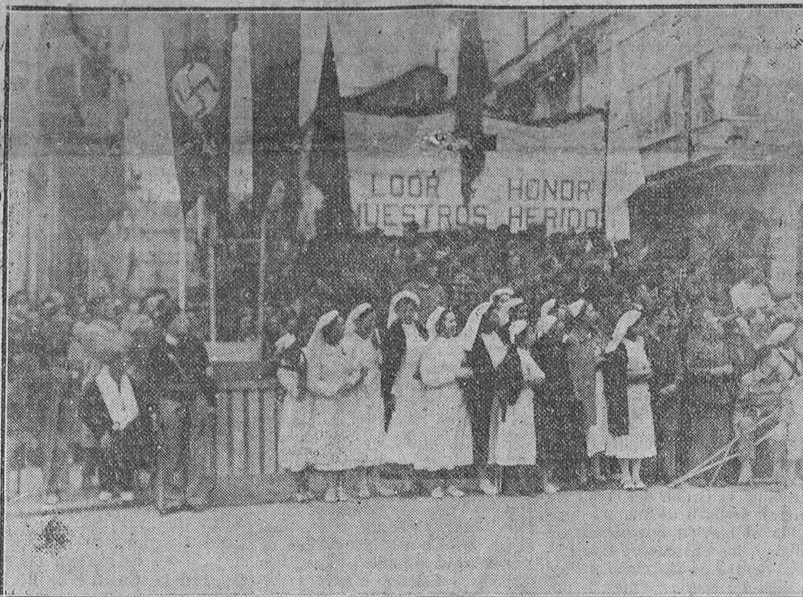
La tribuna desde donde nuestros heridos presenciaron ayer el grandioso homenaje a nuestra Brigada. (Foto PENSAMIENTO ALAVES).

Al final hizo un llamamiento a los jóvenes instándoles a alistarse en las milicias, tercios y falanges de la Acción Católica. Hubiéramos deseado publicar íntegra la bellísima conferencia, pues se nos ha-