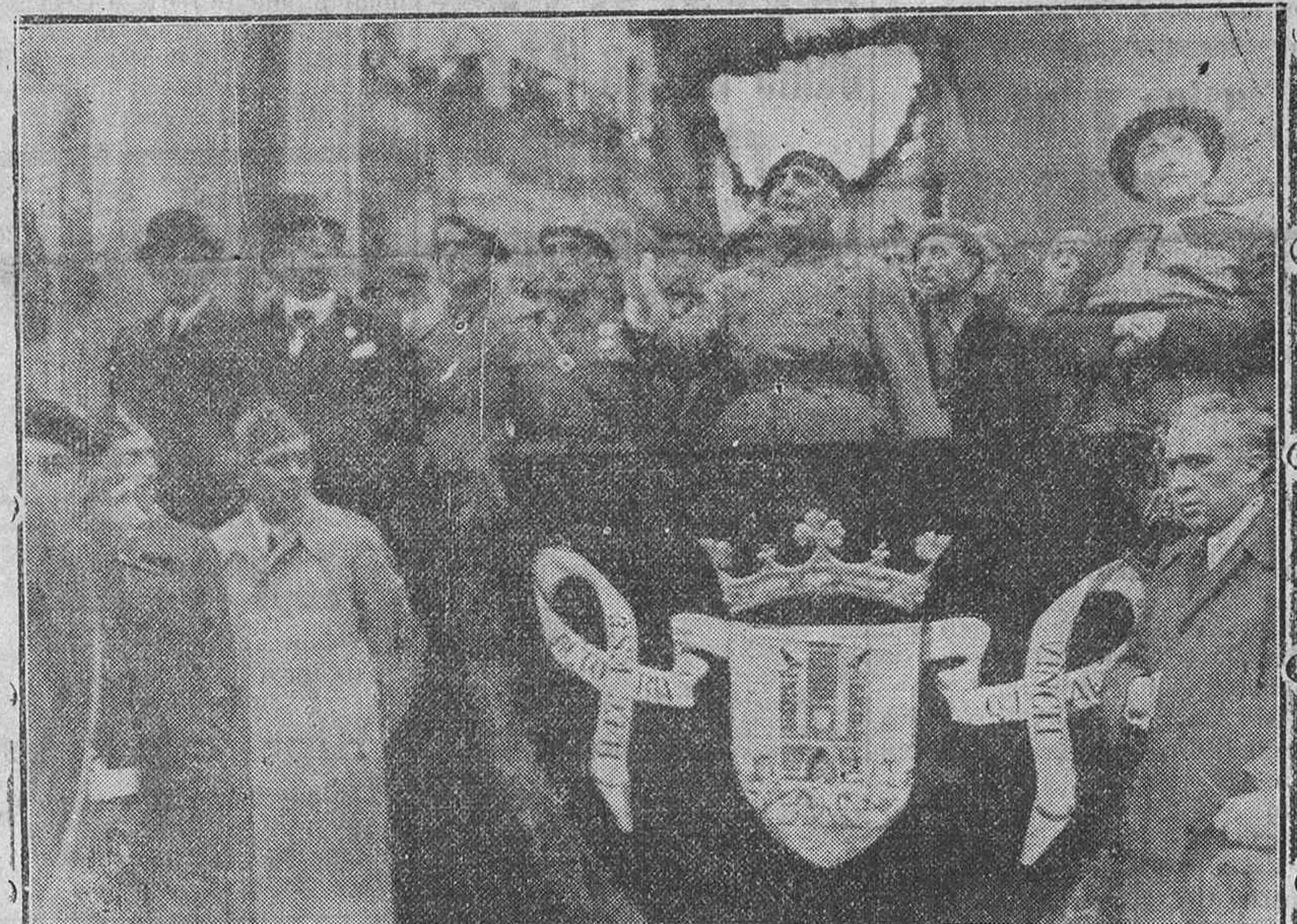
Tribuna de las autoridades durante los actos de ayer, al dirigir la palabra a la muchedumbre el general López Pinto.

lancia el pueblo de Vitoria, una ca oí cantar el "Cara al Sol", se del Tradicionalismo, cantó con entusiasmo supremo, como yo nun Franco! hasta quedar enronque-