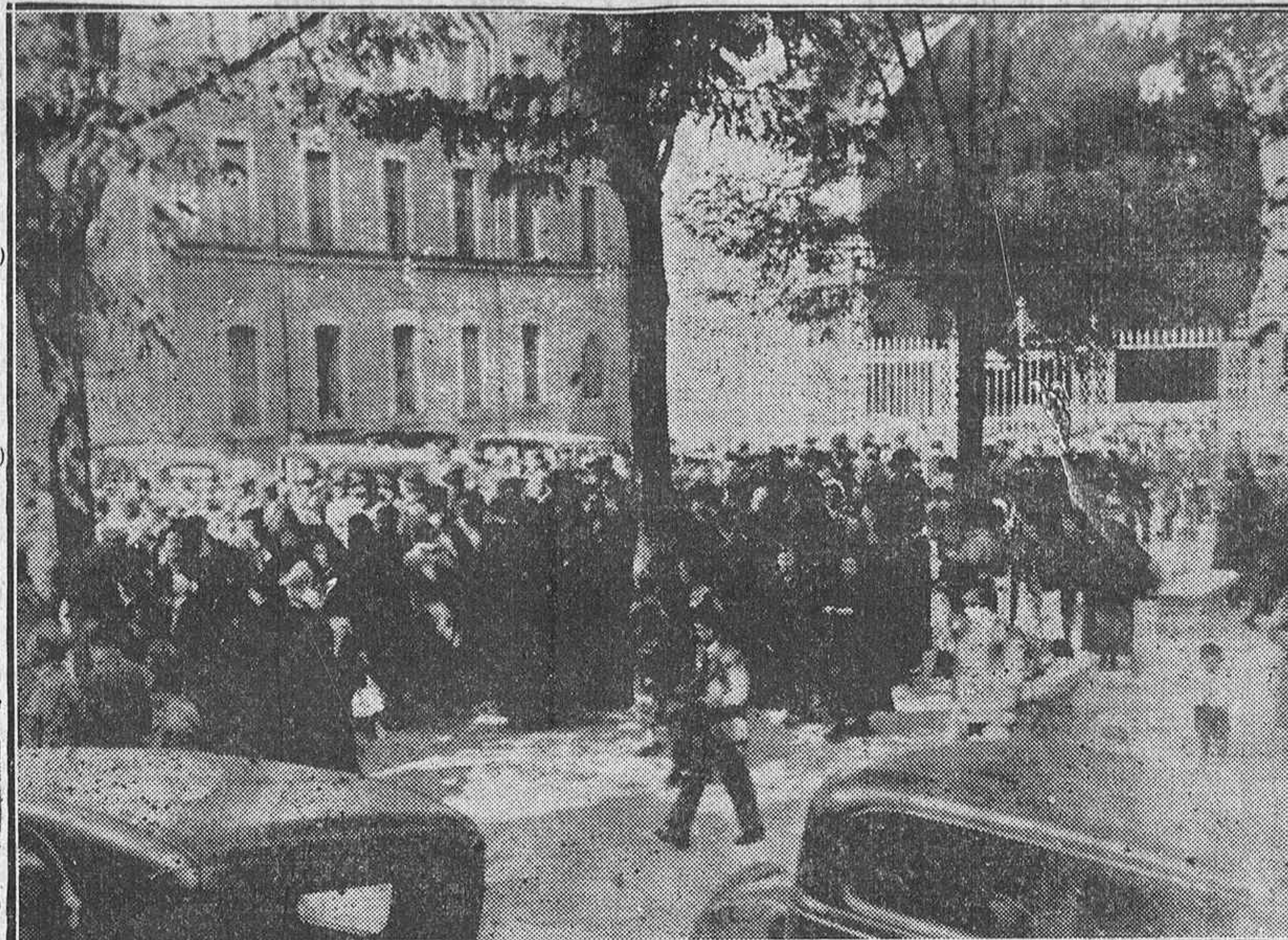
En las inmediaciones de la Catedral el público espera la llegada de autoridades a la Misa y solemne "Te Deum"

Las fuerzas que han de tomar parte en el desfile, se concentran en el Parque y Paseo de la Florida de donde parten en correc-