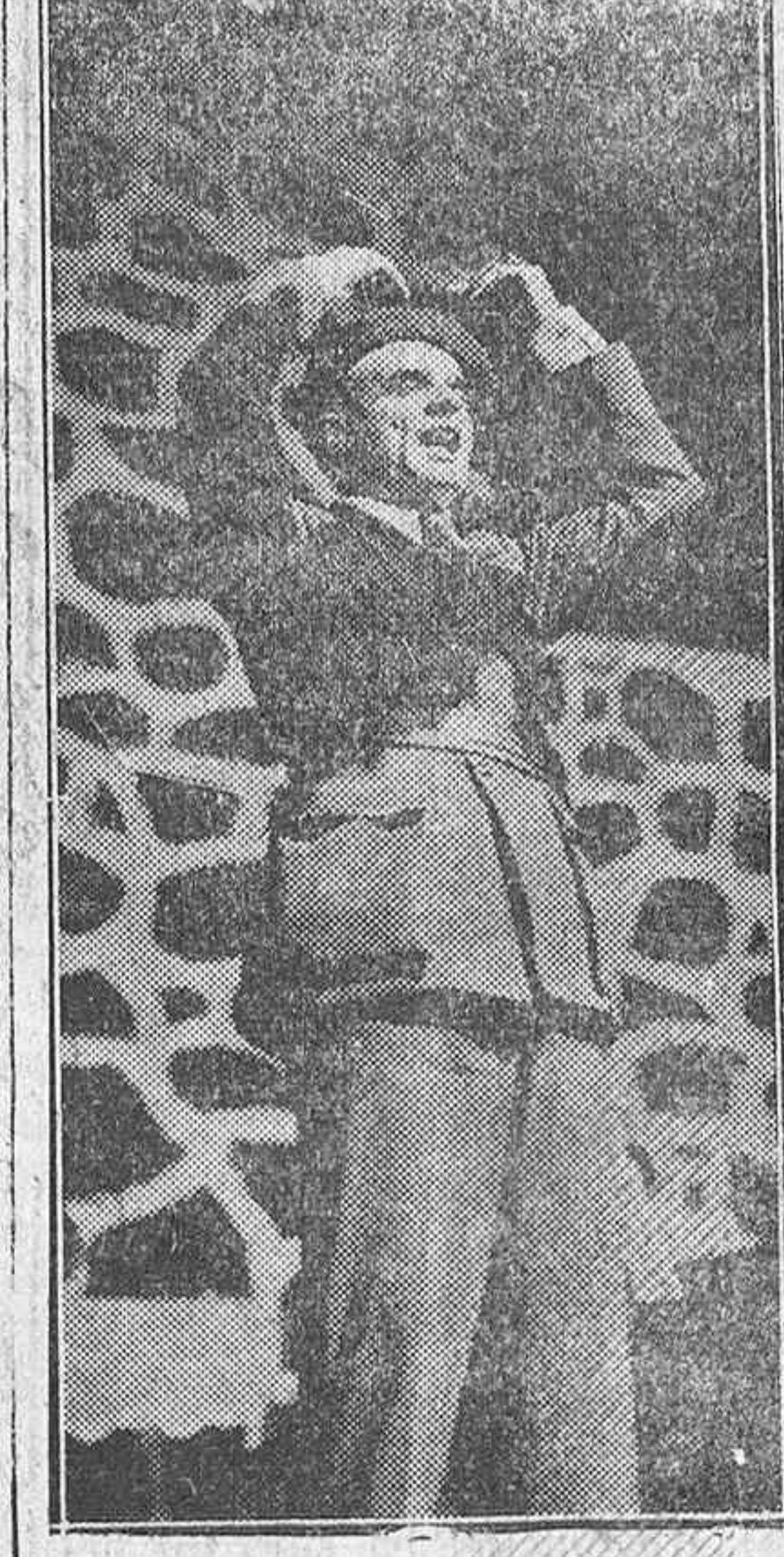
El señor Gobernador civil, don Eladio Esparza, durante su discurso de ayer en Llodio

los años de más dura lucha, el espíritu magnífico de españolismo que se respira en Llodio.