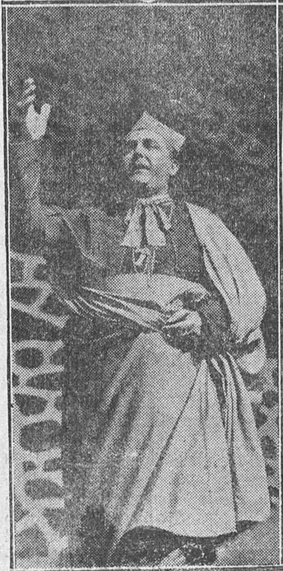
Nuestro amadísimo Obispo, dirigiendo la palabra al pueblo de Llodio