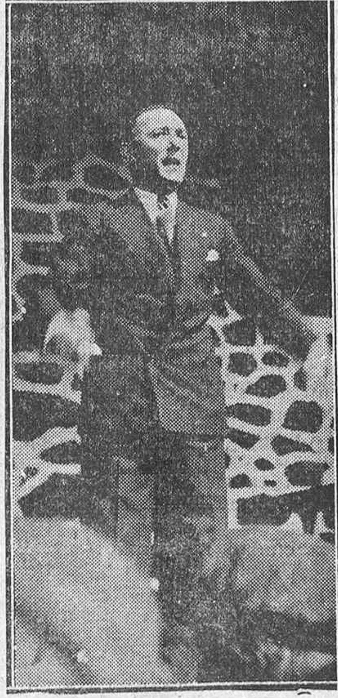
Don José María de Urquijo, alcalde de Llodio, hablando a su pueblo en los actos de ayer

ador civil, magnífico como todos los suyos, fué subrayado por clamorosas ovaciones, dándose repetidos y entusiastas vivas a Navarra.