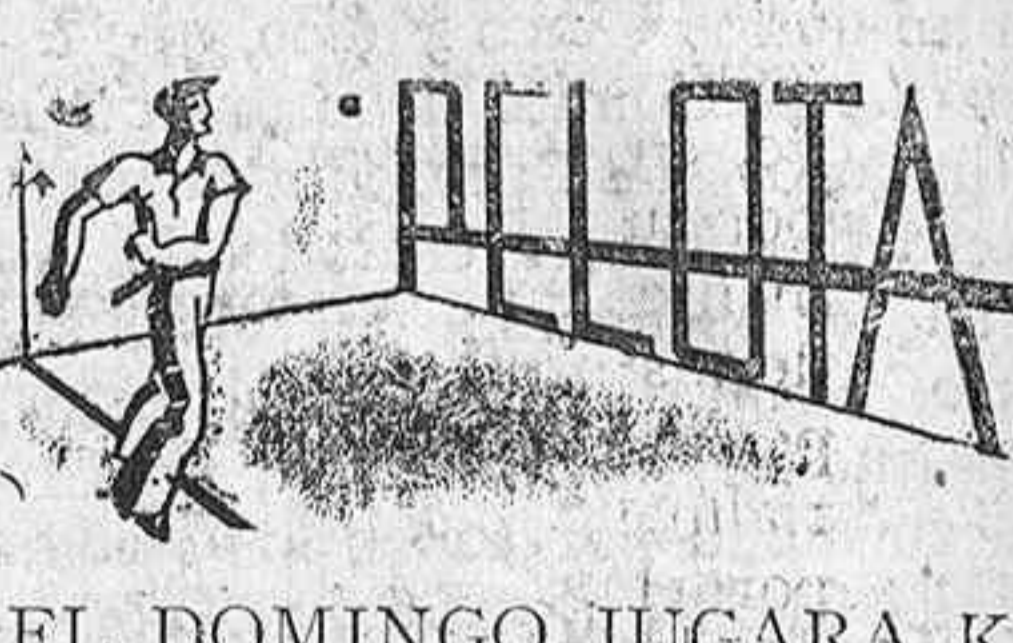
EL DOMINGO JUGARA KIRRU EN EL ASTELENA DE EIBAR

Hasta ahora no se saben las causas del accidente. Unicamente, que el aparato se incendió, lo cual les obligó a hacer uso de los paracaídas.