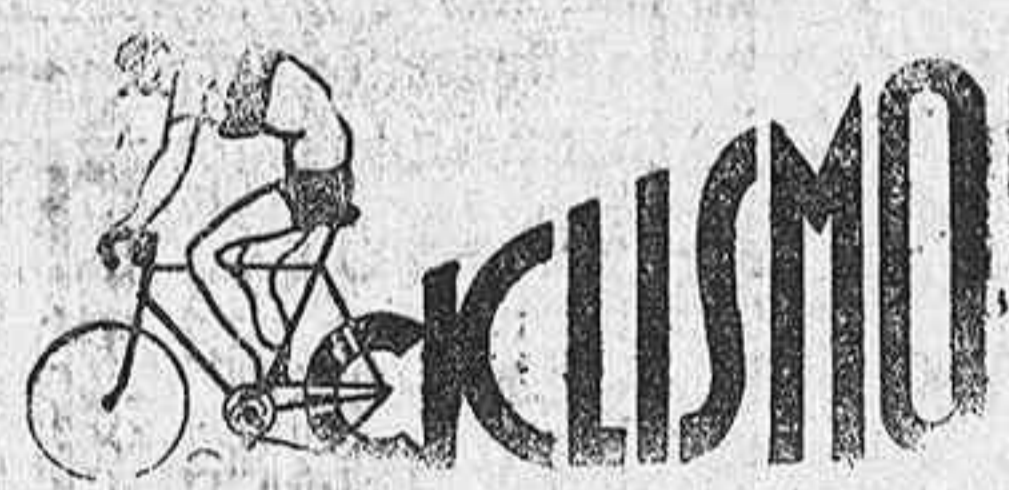
EL CAMPEONATO DE ALAVA

En Madrid reina gran animación ante el partido Athletic-Madrid. - Otras noticias