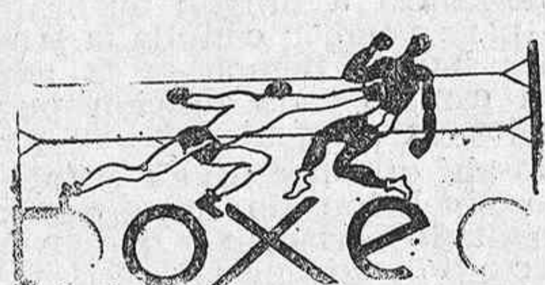
EL CAMPEONATO ITALIANO DE LOS PESOS GALLO

organizaré su PUBLICIDAD y confeccionaré ANUNCIOS de efectivo resultado. Su ESCAPARATE llamará más la atención arreglándoselo GRATUITAMENTE. E. Pérez, Técnico Publicitario. Fonda Argentina, Dato 36, segundo. Teléfono 1799.