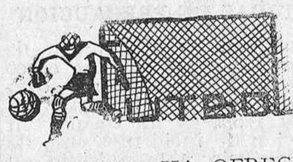
EL TOLOSA HA OFRECIDO SU CAMPO AL AYUNTAMIENTO LOCAL

El combate entre el campeón del mundo, Braddock, y Joe Louis se anuncia para junio próximo. Braddock, que presenció el encuentro desde una de las butacas cercanas al ring, ha manifestado que tiene grandes deseos de enfrentarse cuanto antes con el vencedor de Baer y que el único medio de vencerle es el de boxearle de cerca insistentemente.