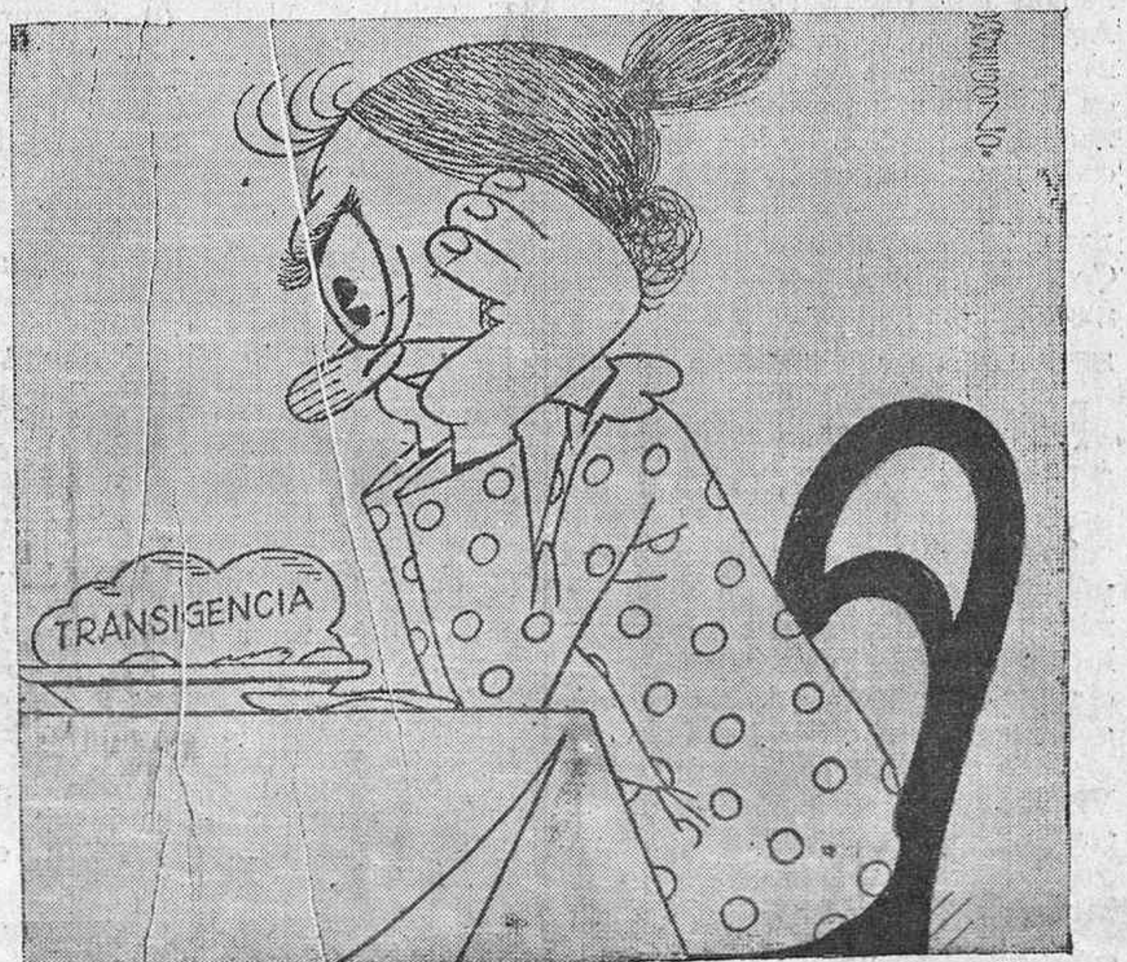
EL ALMUERZO DE DOÑA IZQUIERDA, por Orbegozo. --Y esto, ¿con qué se come?

Católico español: Ayuda a la Prensa Católica y Española anunciando en ella