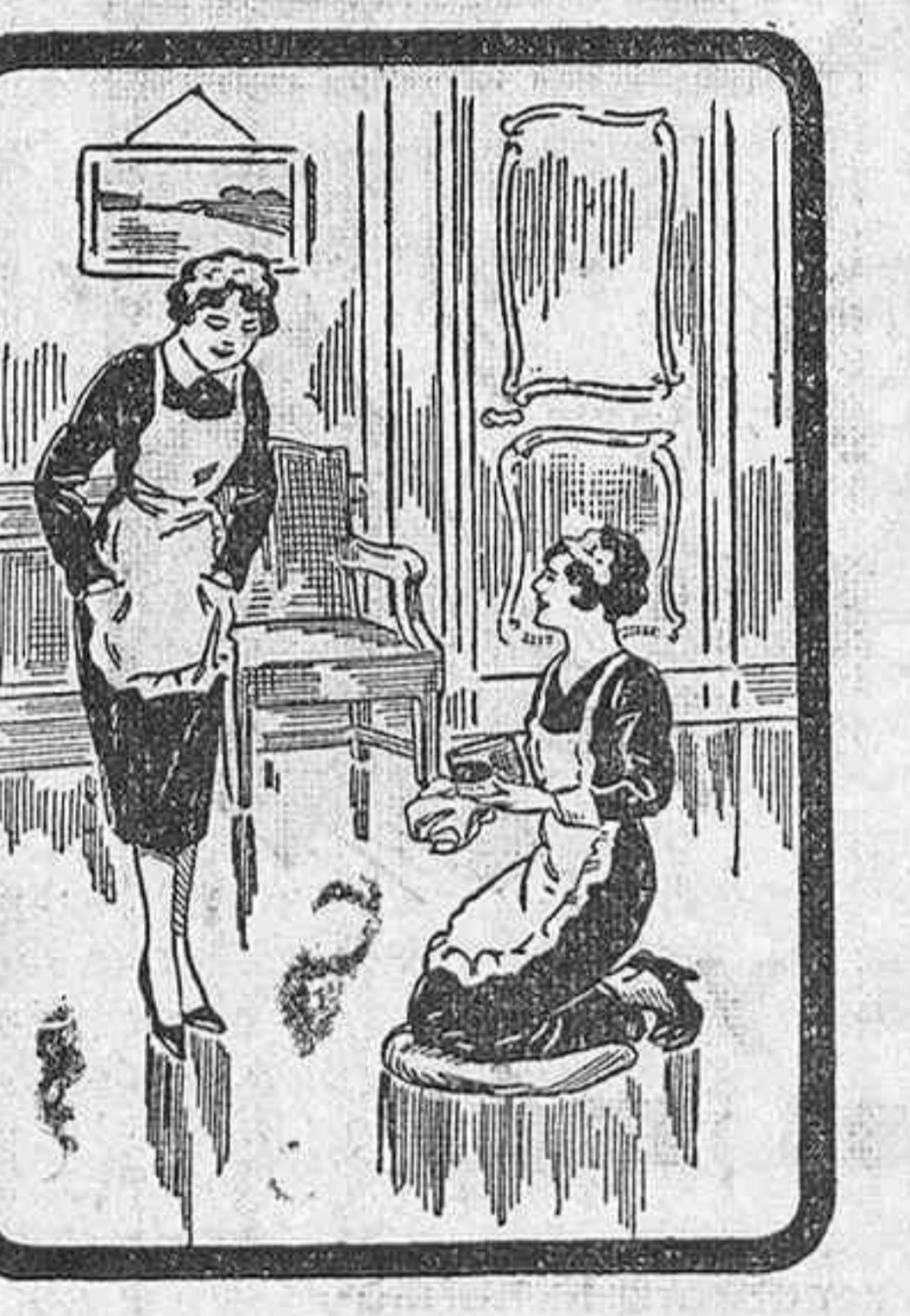
—DA GUSTO VERLAS

Roma.—El domingo, en diferentes puntos de Italia, que a continuación se mencionan, se disputaron estos partidos de fútbol: En Roma: Roma, 2; Yugoslavia, 0. En Milán: Ambrosiana, 2; Milán, 2. En Génova: Génova, 2; Lazio, 2. En Nápoles: Nápoles, 0; Newcastle, 0. En Palermo: Palermo, 1; Messina, 1.