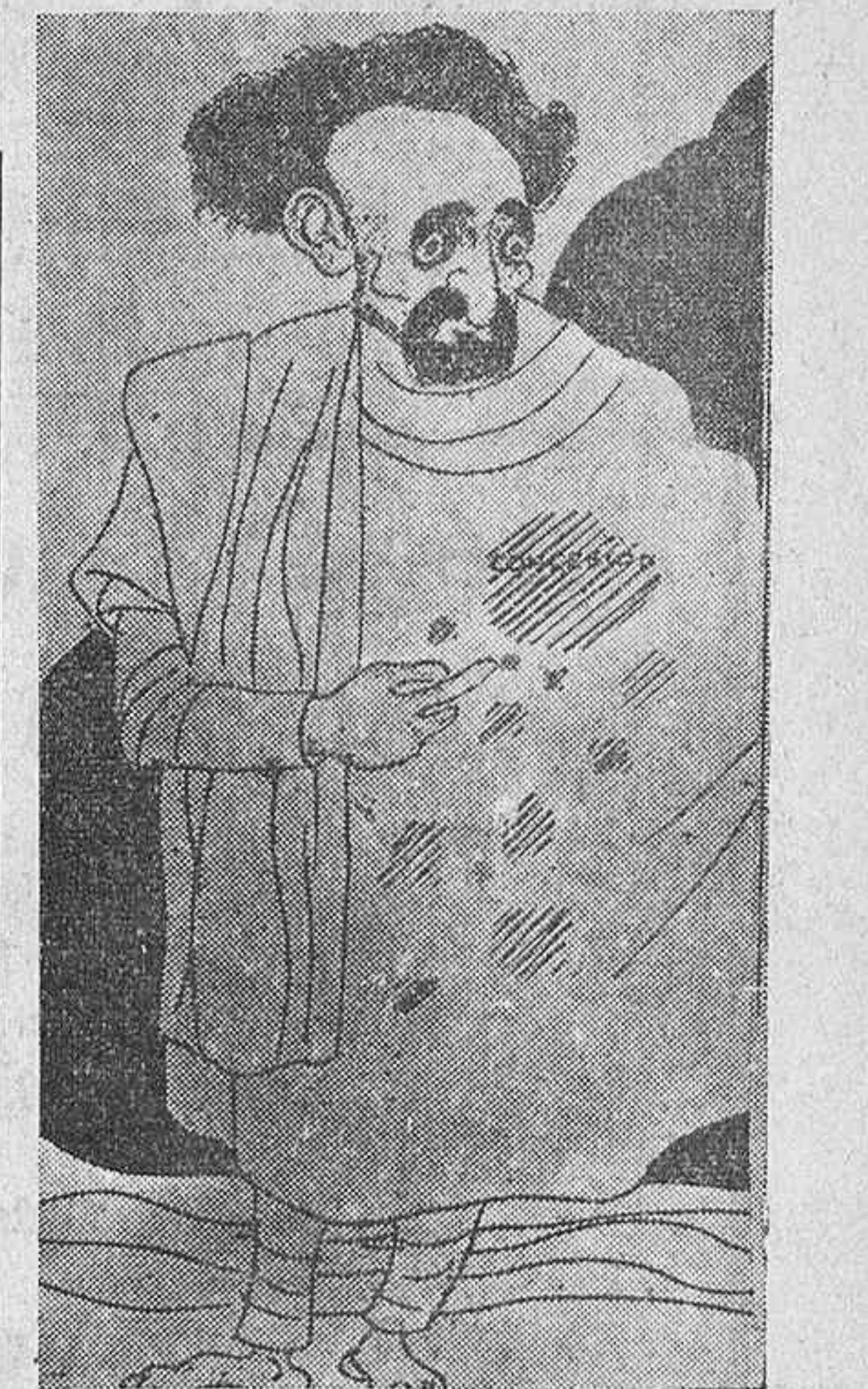
EL NEGUS, por Galindo —¡Me parece que estas manchitas de petróleo me van a terminar de estropear el traje!