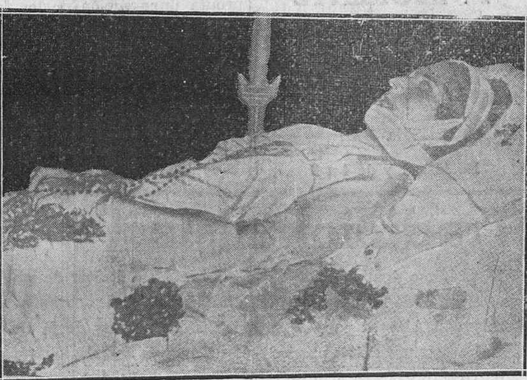
El cuerpo yacente de la infortunada Reina de Bélgica, expuesto al pueblo de Bruselas en Palacio Real.

Y ahora un ruego. Agotada la edición del número de ayer, agradeceremos a quienes ya hayan leído el periódico y no quieran conservarlo, se dignen remitirlo a nuestra Administración para, por lo menos, cumplir algunos de los muchos encargos que se nos están haciendo y que, desgraciadamente, no podemos servir.