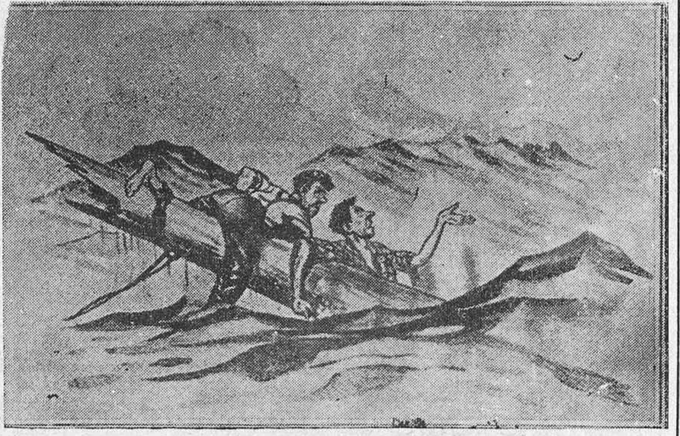
LOS NA UFRAGOS — ¡Vaya una mala pata! Ahora se pone a llover...

Pedagogía activa, Centros de interés, enseñanza esencialmente realista, cultura física, esmerada educación social. Amplios salones y jardín, cuidadosamente atendida la higiene, material pedagógico moderno. Anexo a la Academia Garibay