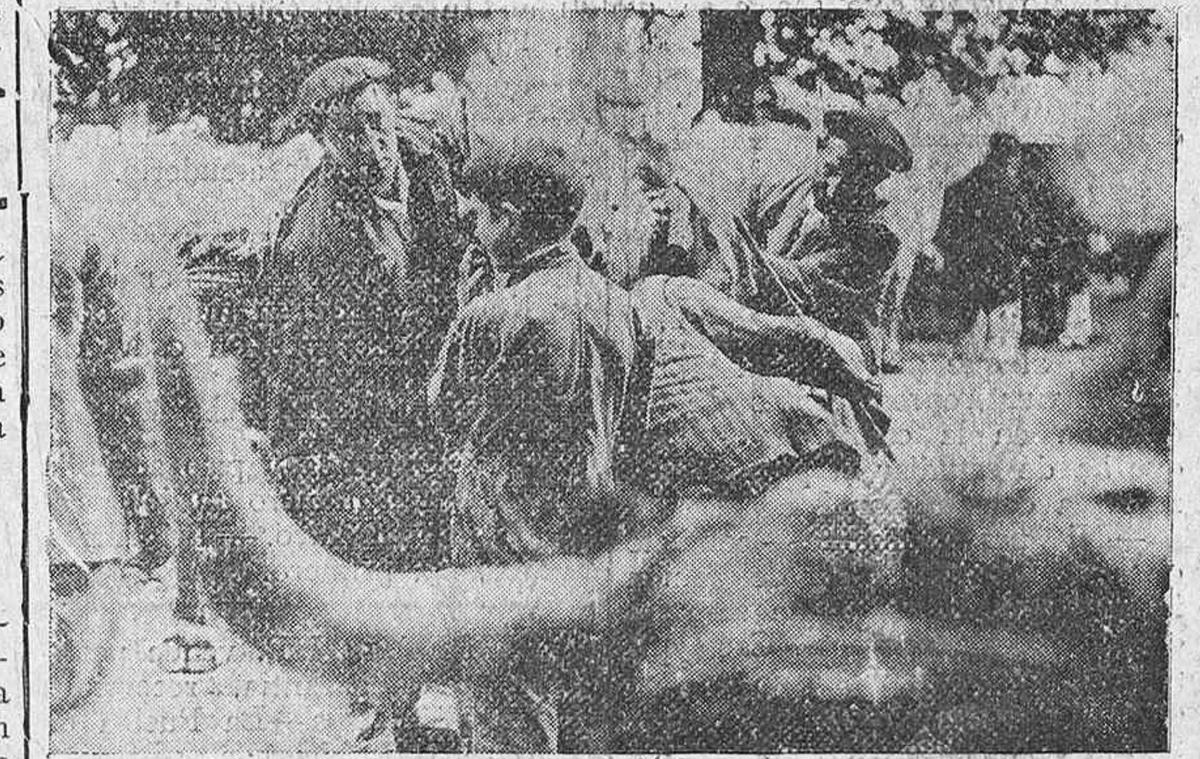
Los tratantes, reconociendo a una pareja de bueyes. (Fotos Ceferino).

nuestras impresiones, nunca en el sentido que se dice.