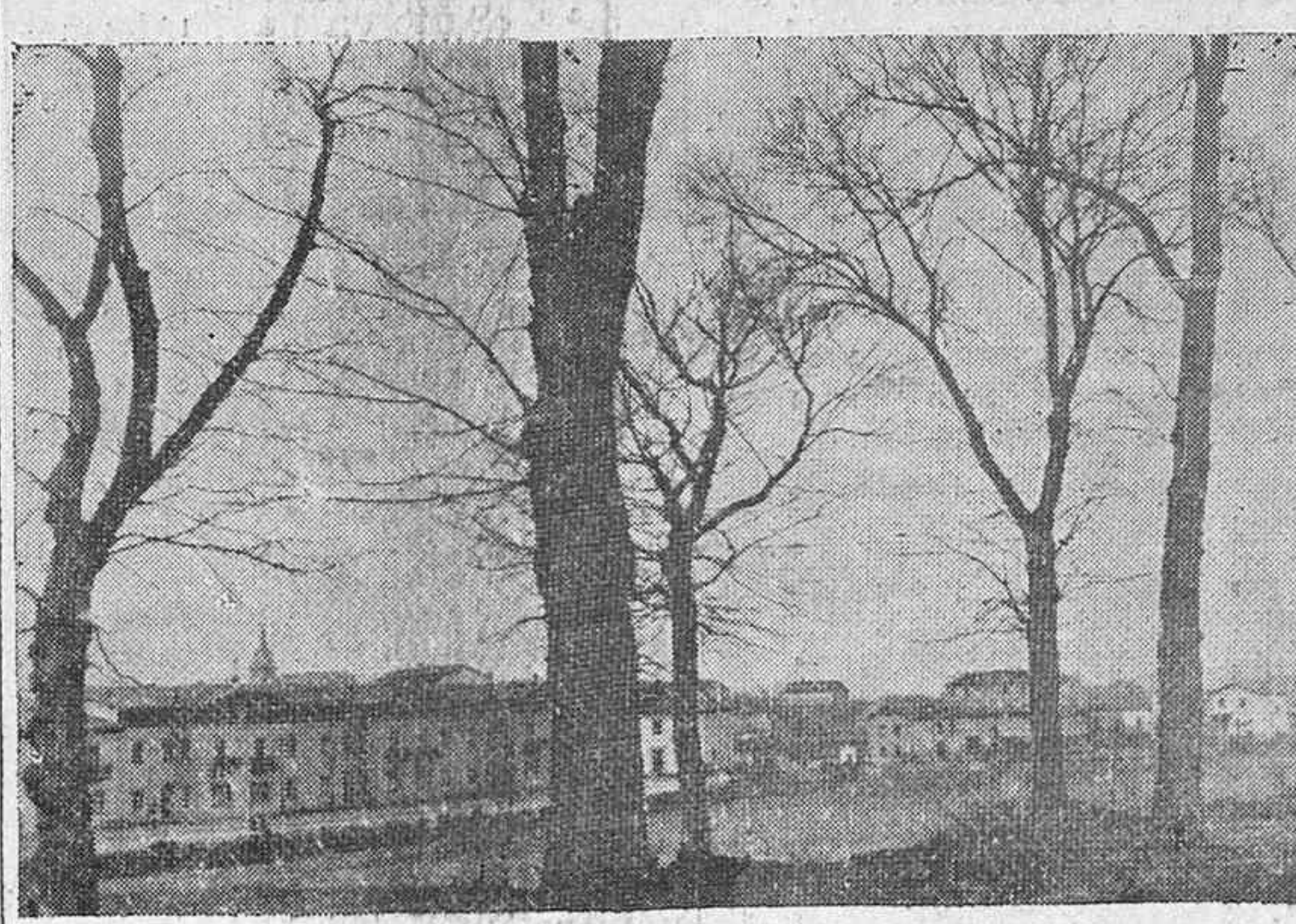
Vista panorámica del nuevo barrio de Judizmendi.