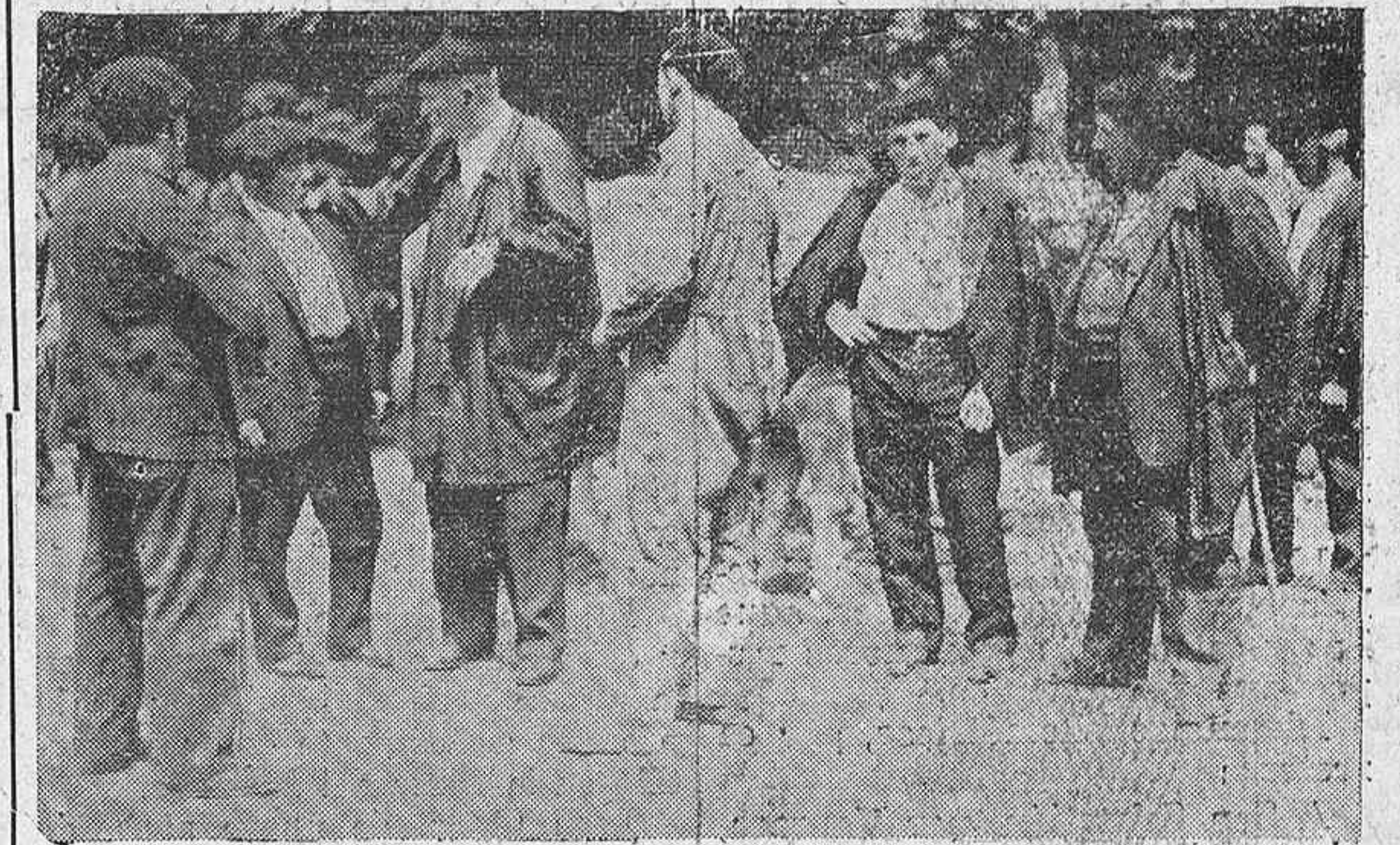
Haciendo el trato de una pareja de bueyes.