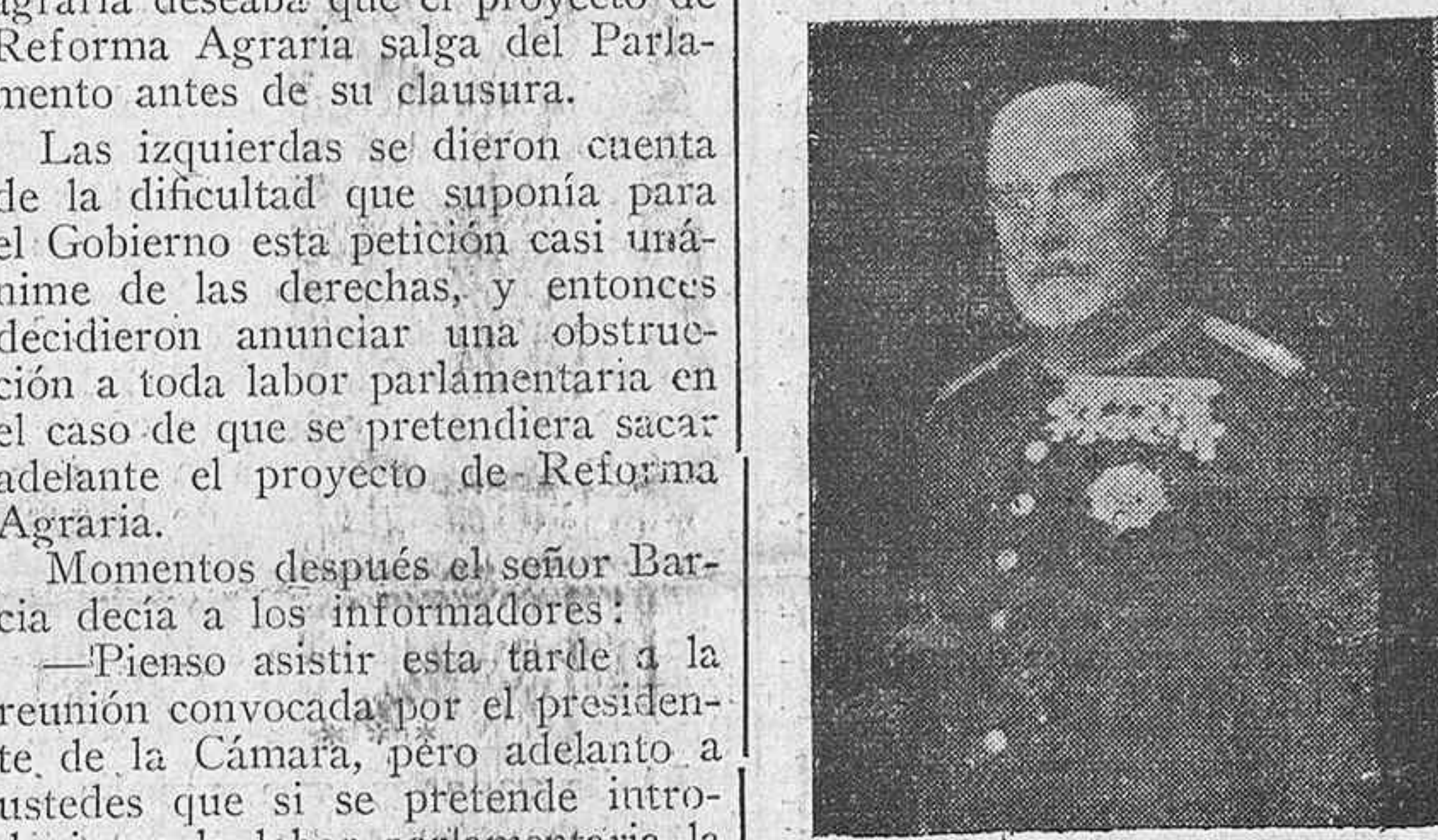
El subsecretario del Ministerio de la Guerra, D. Joaquín Fanjul Goñi, a quien se ha tributado un homenaje con motivo de su ascenso a general de división.

mantuvieron irreductibles en su propósito de que el proyecto se discutiera y se apruebe. Hubo una tendencia intermedia: conciliadora, de la que fueron portavoces los señores Maura y Ventosa.