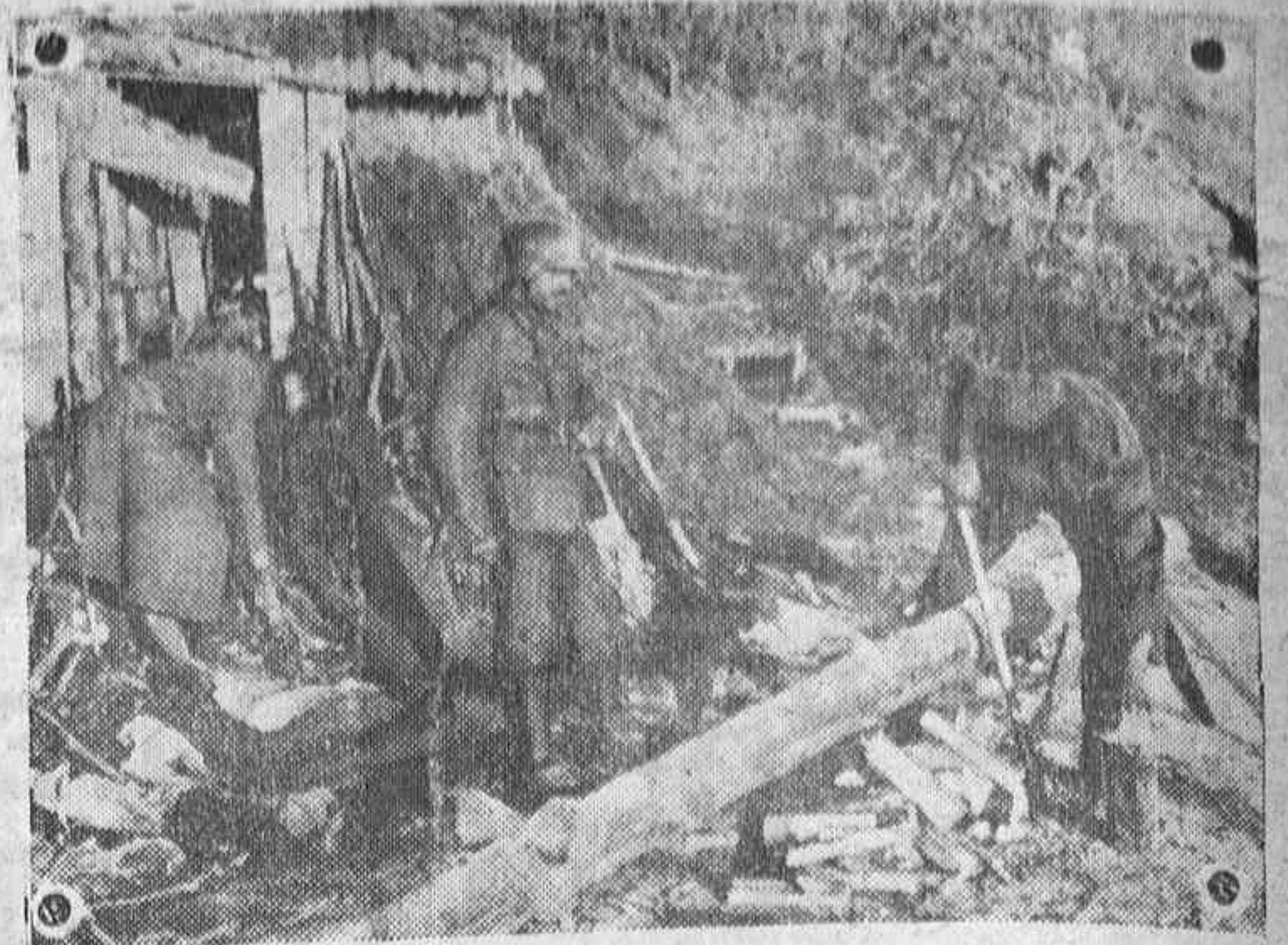
Soldados alemanes de un puesto de mando del frente de San Petersburgo parten leña para el fuego que siempre tiene que haber en esas latitudes.

Máxima: 20 grados en Alicante. Mínima: 7 grados bajo cero en Albacete.