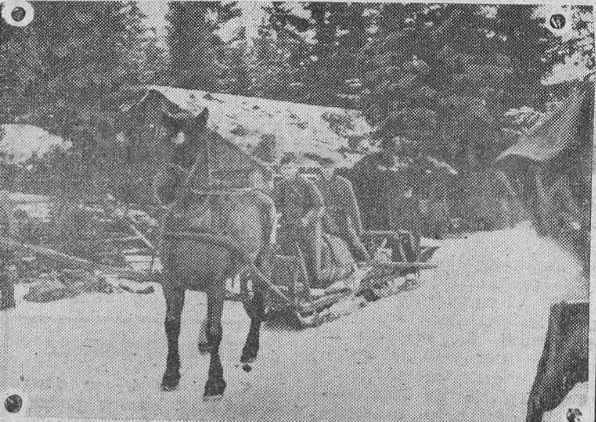
Para el transporte de víveres y municiones en el frente de San Petersburgo las tropas alemanas usan trineos arrastrados por caballos

Nueva York.—Los guardacostas norteamericanos han embargado el trasatlántico francés "Normandie" y han retirado todas las tripulaciones francesas de todos los buques de dicha nacionalidad que se encuentran en puertos de los Estados Unidos.—Efe.