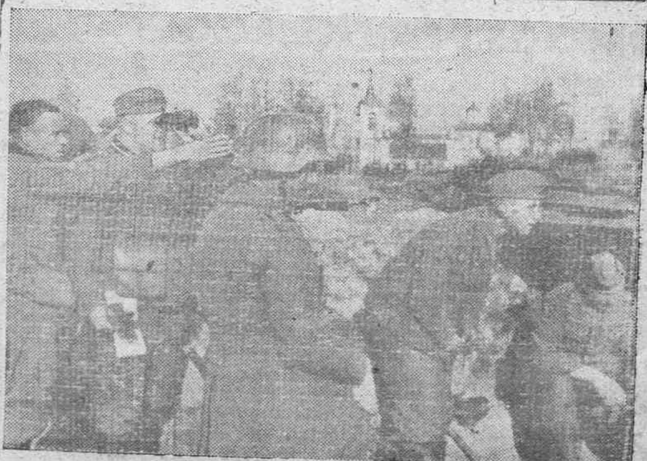
En una ciudad rusa del centro. El jefe de una patrulla alemana examina las posiciones soviéticas ya fuera de la ciudad.

Art. 660. Concluida la defensa, el presidente preguntará al acusado si tiene algo que añadir, y oído lo que exponga, se dará por terminada la vista.