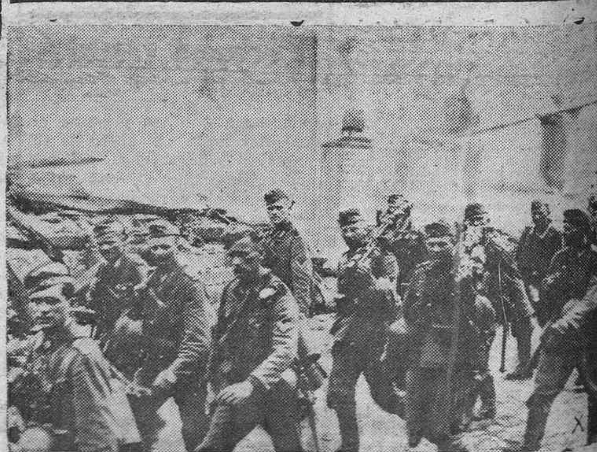
TROPAS ALEMANAS ENTRANDO EN UNA LOCALIDAD DEL CERCO DE SAN PETERSBURGO

JOYERIA RELOJERIA PLATERIA DATO, 8 VITORIA