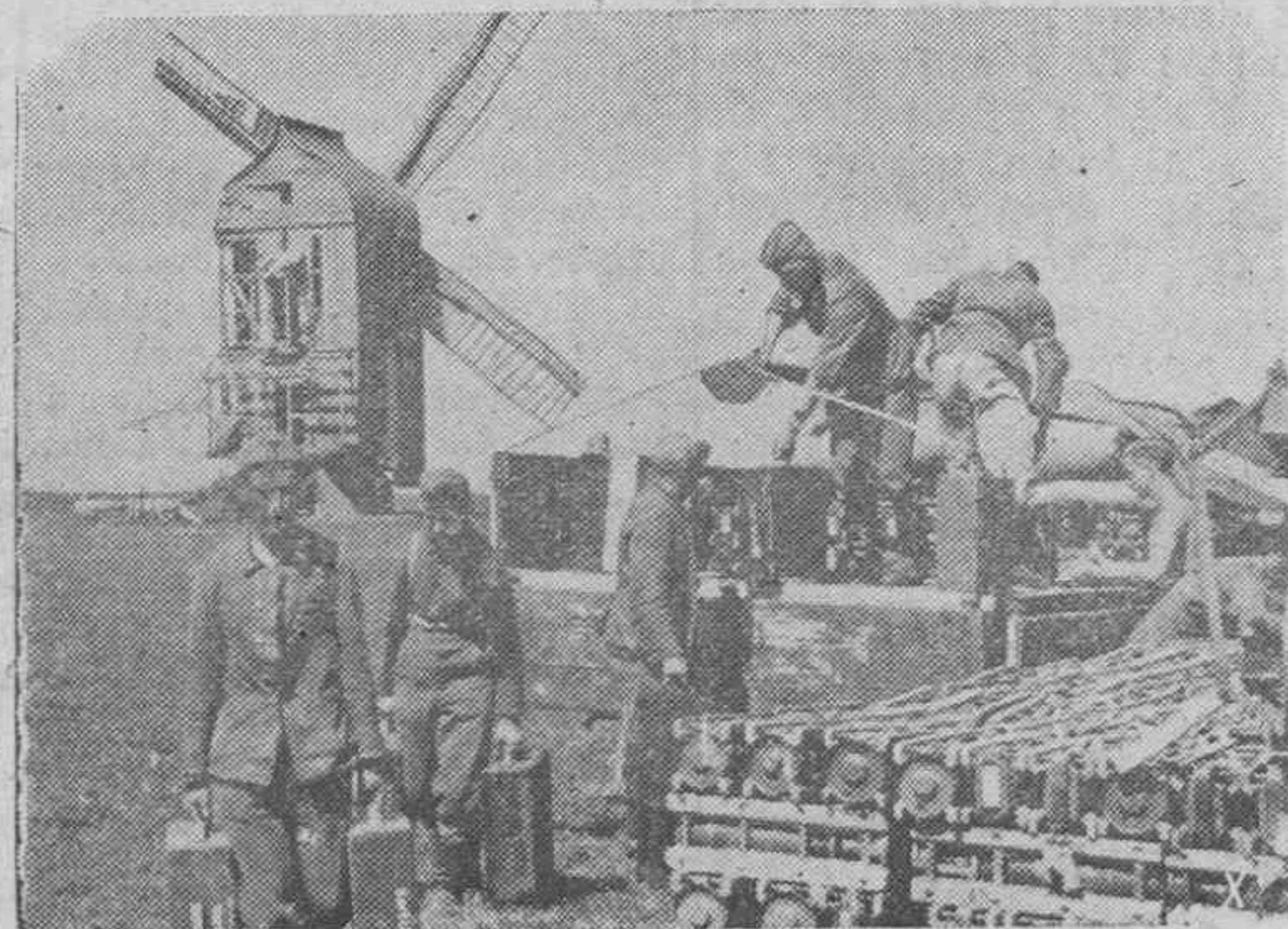
Llegada de municiones para una sección de infantería alemana en el frente oriental.

2.269 Préstamos Nupciales para trabajadores de ambos sexos concederá la Caja Nacional de Subsidios Familiares a aquellos que lo soliciten antes de finalizar el presente mes de julio. Será requisito indispensable que el matrimonio se celebre en el mes de septiembre próximo.