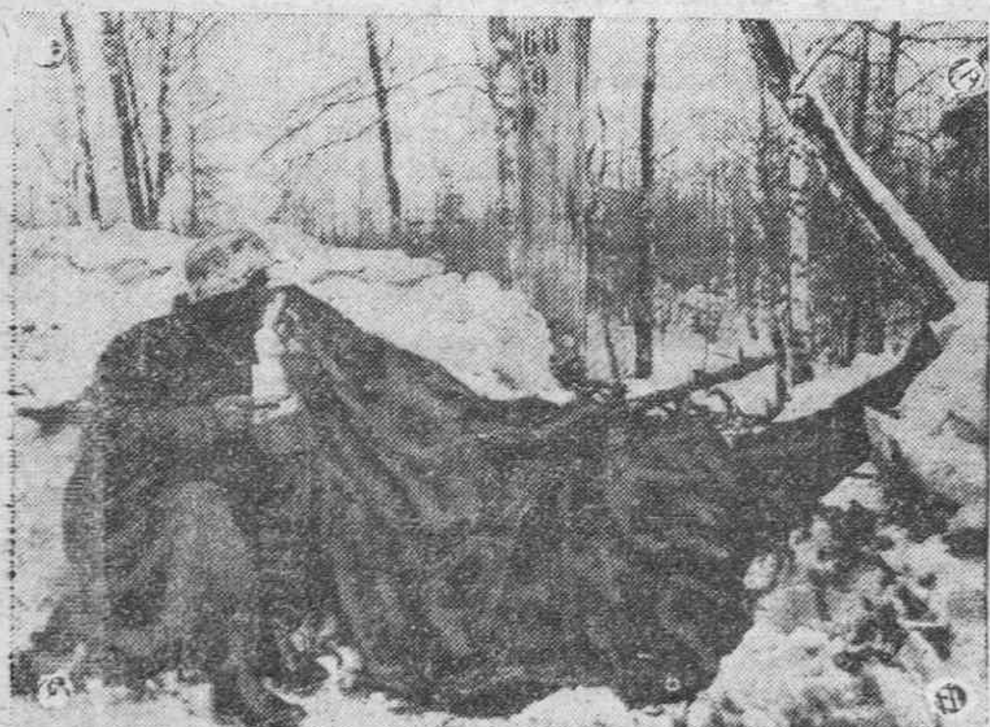
Un puesto de ametralladora avanzado de las tropas alemanas en Rusia; el tirador está comiendo el rancho que le acaba de llevar un camarada, pero no por eso pierde de vista la tierra de nadie.

Mínima: 0 grados, en Vitoria y Patencia.