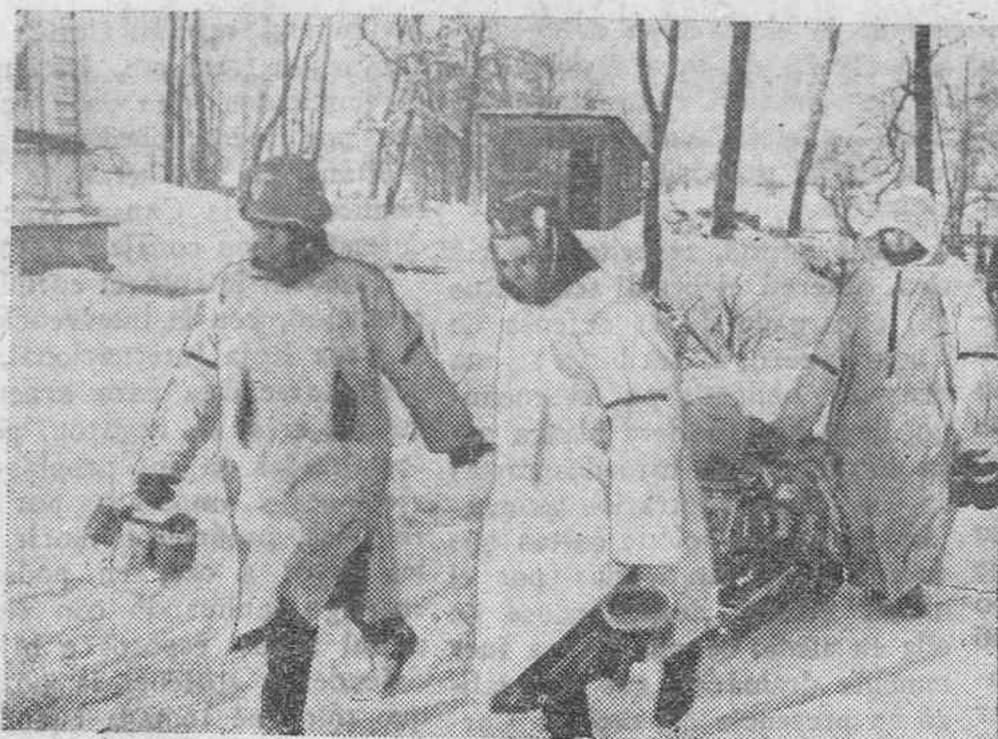
Soldados llevando con trineos, al depósito de intendencia, las pieles que llegan de la retaguardia, para sus equipos de invierno.

Las marchas forzadas, que hacen sudar el cuerpo, mientras los miembros están helados, tienen el premio de una carta, "de allá". El pe-