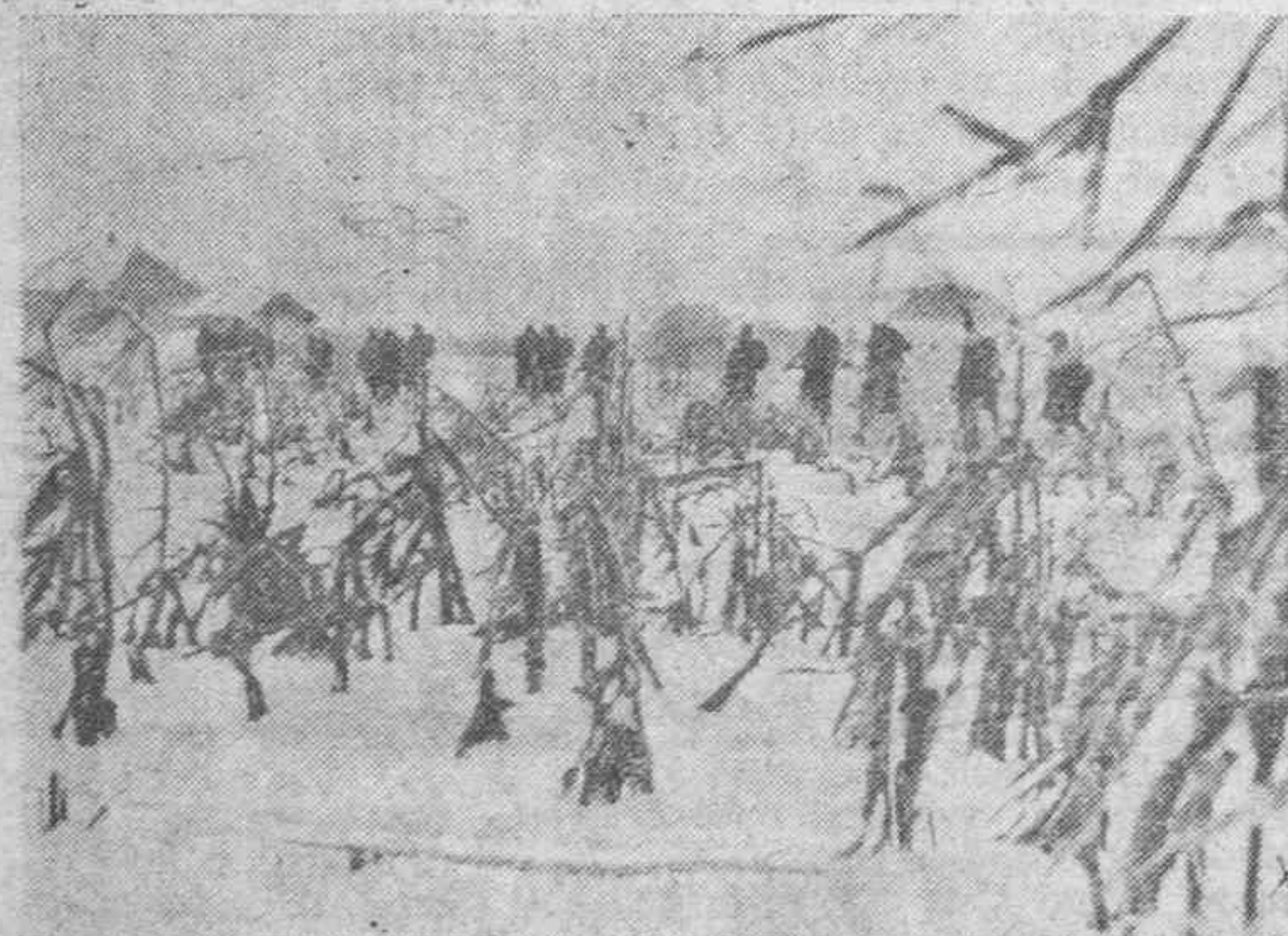
Tropas italianas pasan un campo de maíz en la región del Donetz, con una fuerte tempestad de nieve que ha cubierto por completo el campo.

Los ataques llevados a cabo por el Ejército alemán y sus secciones de Asalto han logrado éxito. Setenta y cinco carros de asalto fueron destruidos en total al adversario durante la jornada de ayer.—Efe.