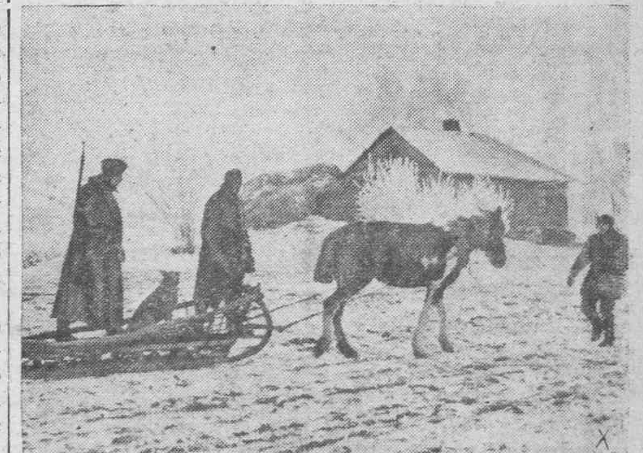
El caballo ruso, pequeño pero resistente a las inclemencias del invierno, es muy usado por los soldados alemanes en el arrastre de trineos con cargas para las avanzadas