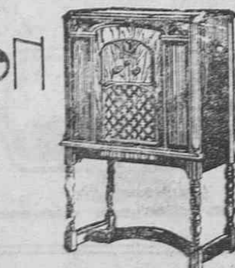
RCA 80.—Super-heterodyna eléctrico, cábulos de rejilla blindada, altavoz electrodinámico

Representante General Radio-Electricidad R. CABEZON San Prudencio, 17.—VITORIA