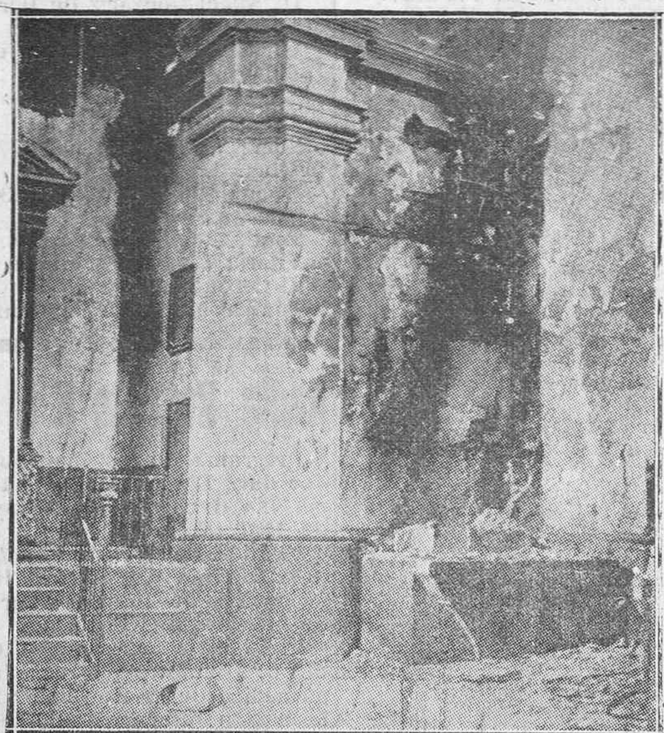
Fernán Núñez (Córdoba).— Ermita de la Veracruz incendiada por los rojos; a la derecha se ve lo que queda del valioso altar de la Inmaculada Concepción, que se venera en la misma